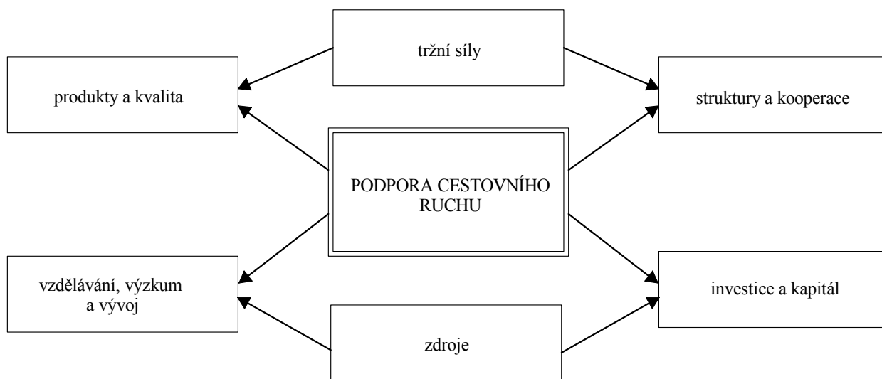
Obr.1: Cílená podpora cestovního ruchu - podpora strukturálních změn a zhodnocení zdrojů

Ve Švýcarsku se současné době postupuje podle turistického programu schváleného na dobu 2003 – 2007. Největší část finančních prostředků je určena na podprogram na podporu inovací a spolupráce v cestovním ruchu (InnoTour), na vzdělávání pracovníků v cestovním ruchu a na úvěry a bankovní záruky v hotelnictví. Tento program by měl urychlit strukturální změny a společně se soukromým sektorem vyvolat v uvedených pěti letech investice ve výši přibližně 1,1 miliardy Franků. Výše uvedeného cíle švýcarské politiky cestovního ruchu má být dosaženo prostřednictvím rozvoje nových produktů, zvýšení kvality a překonání nedostatků plynoucích ze struktury malých a středních podniků působících v cestovním ruchu prostřednictvím kooperací. Přitom by se měly posílením inovační schopnosti využívat stávající endogenní možnosti růstu. Schematicky lze podporu cestovního ruchu Švýcarské konfederace znázornit následovně.