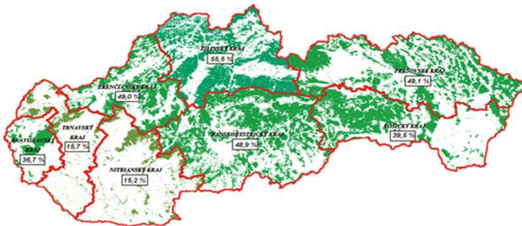
Obr. 1 Lesnatost' v Slovenskej republike na úrovni NUTS III.