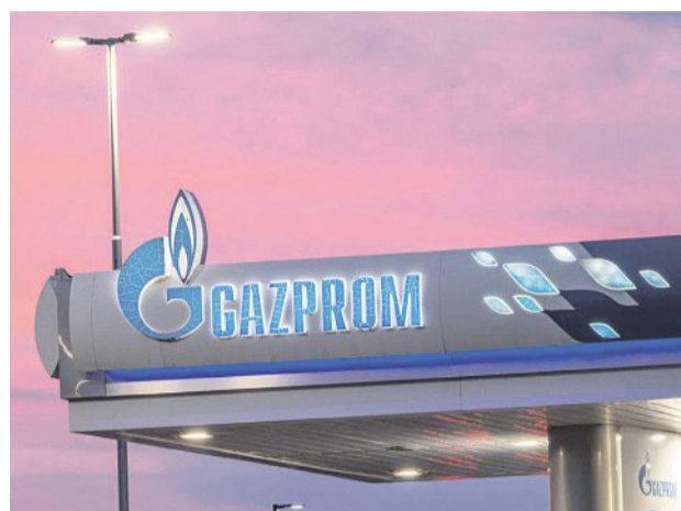
Gazprom počítá ztráty.