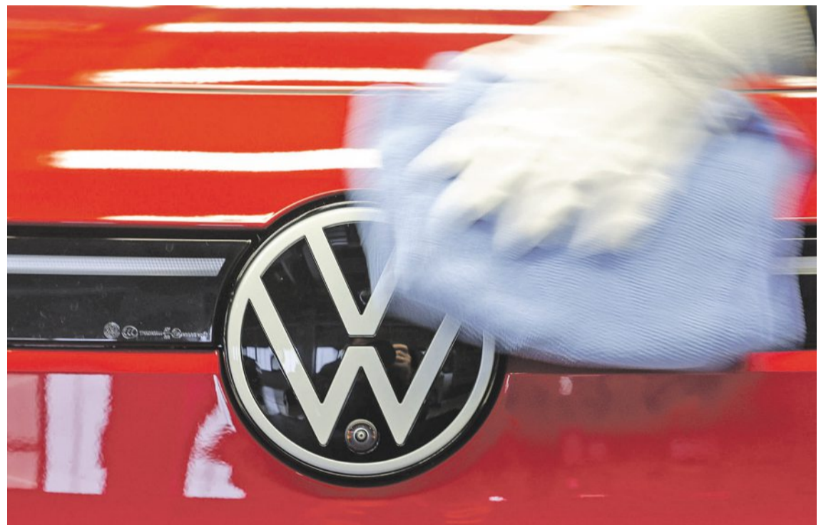
Vyleštit logo nestačí. Značka Volkswagen nemá takovou provozní marži, jakou by si vedení koncernu přálo. Zlepšit finanční situaci má ozdravný balíček.

Schäfer v podcastu prohlásil, že Volkswagen není konkurenceschopný v řadě oblastí. Rostou náklady na suroviny pro výrobu elektromobilů, které firma musí kupovat od třetích stran. Automobily musí VW zdražovat v době, kdy se na trh valí levnější čínská elektroauta. Napak v Číně se Volkswagenu přestává dařit a obchody už tam nemá tak stabilní, jak byl zvyklý. Chybí mu tak příjmy pro to, aby mohl financovat přechod od spalovacích motorů k elektromobilitě.