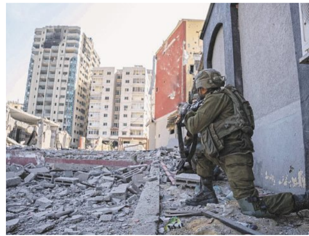
V severní části Pásmu Gazy zuří ostré boje.