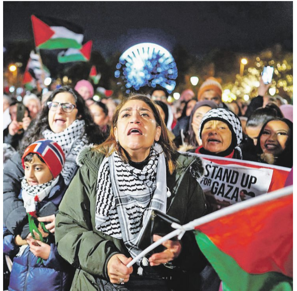
Demonstrace na podporu Palestiny v norském Oslu V prvních dvou týdnech po útoku Hamásu to na sítích vypadalo, že příznivci palestinských teroristů informační válku spíš vyhrávají – důsledkem čehož byly i demonstrace palestinských stoupenců v řadě evropských měst.

Američané považují Čínu za svého hlavního geopolitického soupeře, čímž se také