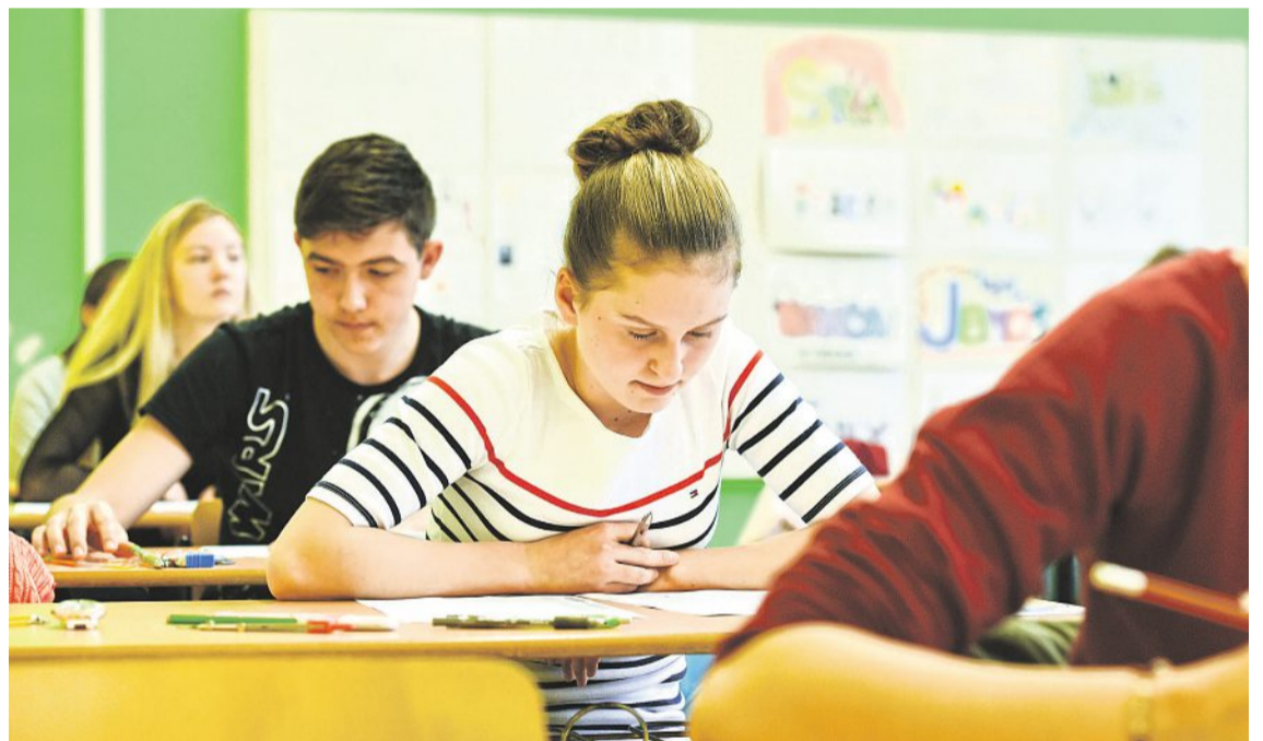
Elektronizace přijímacího řízení by měla zajistit, že po napsání přijímací zkoušky systém žáky automaticky přiřadí na školy, které si zvolí v on-line přihlášce.

Ministerstvo školství nyní plánuje razantní úpravu nabídky středoškolských oborů. Místo dnešních rekordních 283, což je nepřehledné pro žáky, rodiče i zaměstnavatele, by se jich nově mělo podle odhadu náměstka ministra školství Jiřího Nantla (ODS) nabízet kolem čtyřiceti. Největší zápas se plánuje zejména v učňovských oborech. Žáci už by se tak nemuseli v patnácti letech rozhodovat, jestli půjdou například na zedníka, pokrývače nebo tesaře, ale zvolí si obor stavební řemesla.