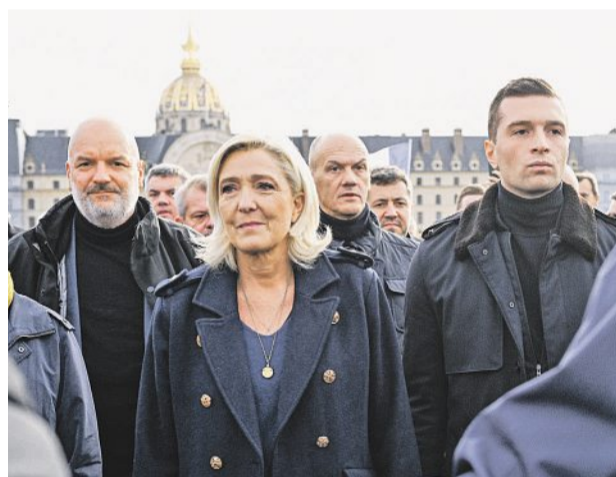
Účast na pochodu je volební strategie Marine Le Penové.

Národní frontu založil otec Marine Le Penové Jean-Marie Le Pen v kruhu pohrobků vichistického režimu, který kolaboroval s Hitlerovou říší. Nenávist vůči Židům patřila mezi opěrné pilíře strany. Sám Jean-Marie Le Pen je zároveň soudem uznán rasista a antisemita. Opakovaně označil holocaust za „detail“ druhé světové války, za což mu francouzský soud vyměřil několikrát pokutu. Le Penová kvůli tomu nechala otce v roce