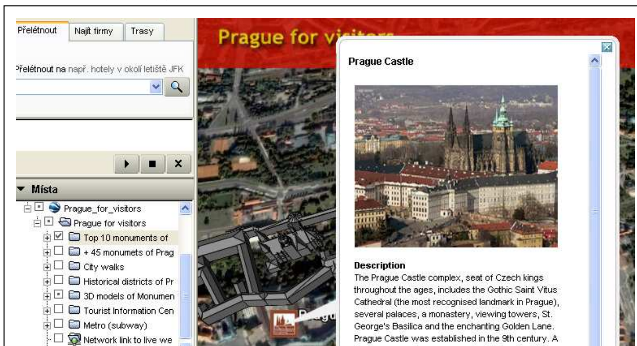
Obr. 2: 3D Praha v GoogleEarth