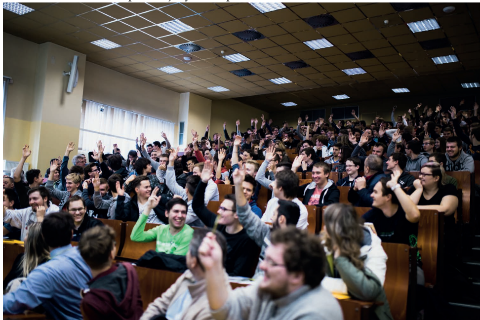
Dny otevřených dveří (více na straně 9)