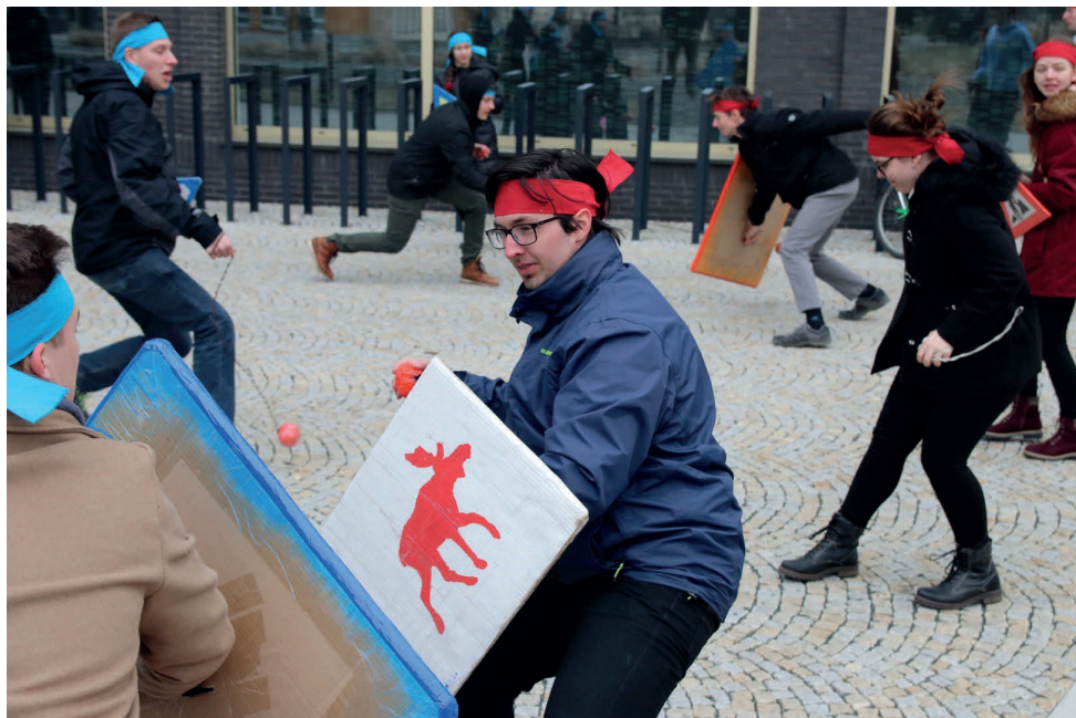
Fotografie z akce Poznej FI