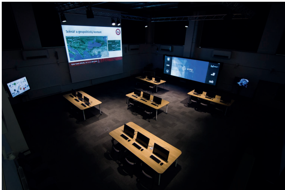
Učebna KYPO, ve které probíhají kyberbezpečnostní cvičení