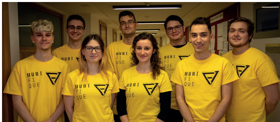
Studentští průvodci pro dny otevřených dveří