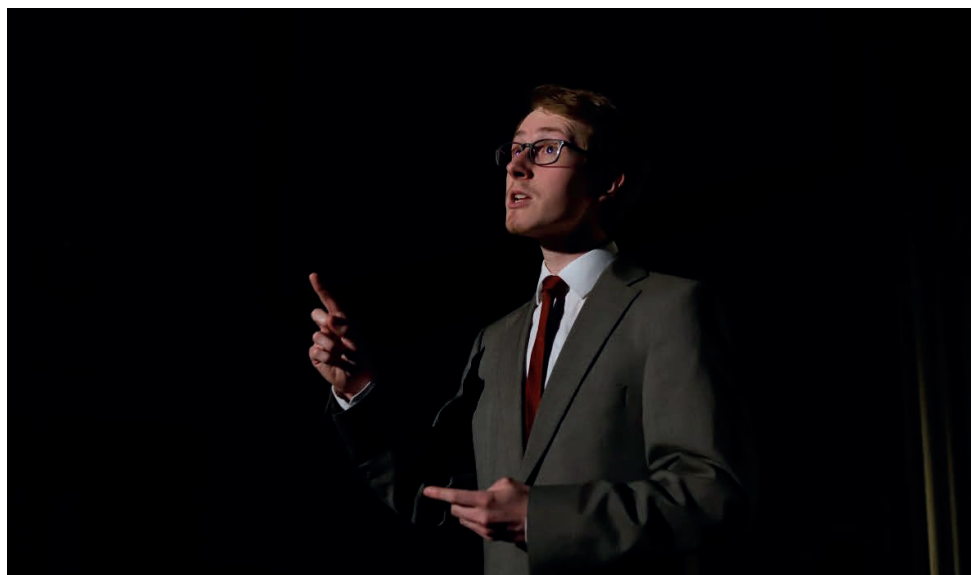
Premiéra hry Alan Turing (2022) studentského ProFIdivadla