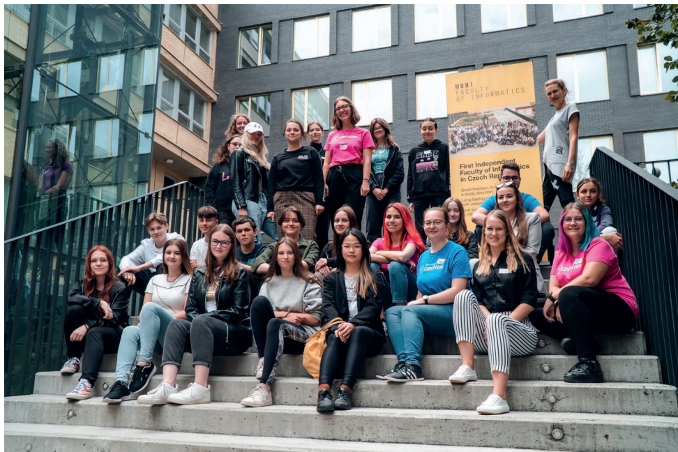
Letní škola IT pořádaná Czechitas ve spolupráci s FI MU