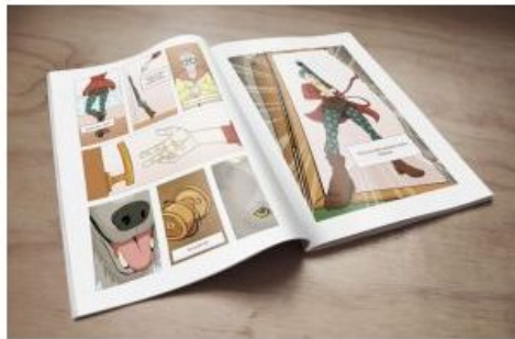
Kniha obsahuje komiksy od 60 studentů

Mezi programátorské jedničky a nuly se snaží vnést kreativitu a uvolněnost. Kromě zábavy ale studenty čekala i práce.