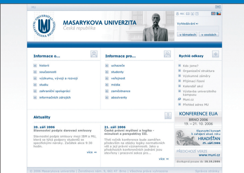
Od 18. září je veřejnosti přístupná nová internetová prezentace Masarykovy univerzity. Mezi hlavní novinky patří zlepšená navigace, zřehlednění informační struktury a použití nového jednotného vizuálního stylu univerzity.

Současně se zlepšila i kvalita a rozsah informací, které návštěvník na stránkách univerzity najde. Web byl obohacen o množství textů, které u předchozí verze chyběly. Nově také byly určeny garanty jednotlivých kategorií, kteří budou zodpovídat za aktuálnost zveřejňovaných informací. Přehlednost a přístupnost nové prezentace významným způsobem zlepšuje i nový grafický styl a intuitivní ovládací prvky.