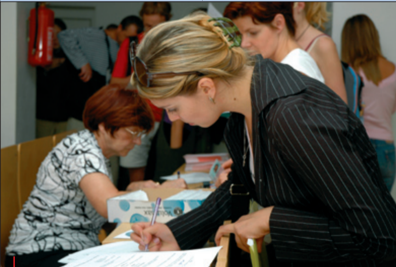
Do bakalářských a magisterských studijních programů bylo na Masarykově univerzitě v akademickém roce 2006/07 přijato více než sedmáct tisíc uchazečů. Snímek z náhradního termínu zápisu na Filozofické fakultě, který se uskutečnil začátkem září.

Kromě přísunu potravy je potřeba zajistit si také nějaké bydlení. V prvním ročníku dostávají všichni koleje, ale u většiny studentů tomu tak nebude věčně. Pokud student nebyd-