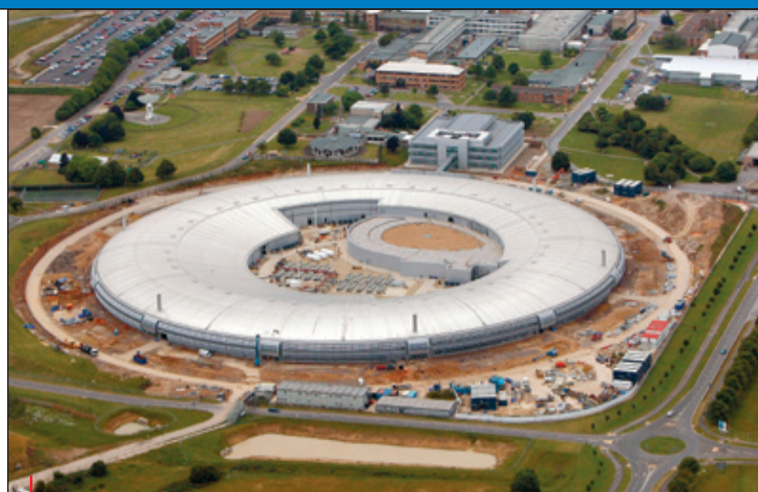
Synchrotron Diamond o výkonu 3 GeV, budovaný v současnosti ve Velké Británii.

Společný postup má samozřejmě své výhody a nevýhody, přináší rizika i zisky, jež musí strategie dalšího postupu brát v úvahu. Silnou stránkou společného projektu brněnských výzkumných institucí je nepochybně pozice Brna jako druhého centra vědy a výzkumu v republice, jehož vědecká produkce výrazně převyšuje produkci ostatních regionů ČR mimo Prahu. Brněnské univerzity mají také na rozdíl od jiných regionů vytvořené, propracované a vyzkoušené mechanismy institucionální spolupráce mezi sebou navzájem i s krajskou a městskou politickou sférou (připomeňme Jihomoravské inovační centrum, Brněnské centrum evropských studií či nedáno založené Jihomoravské centrum pro mezinárodní mobilitu). Regionální a městská politická reprezentace navíc z podpory výzkumu, vývoje a inovací učinila součást své dlouhodobé politické agendy. Úspěšná výstavba Univerzitního kampusu v Bohunicích, úspěch iniciativy k založení ICRC či pořádání letošní konference Evropské univerzitní asociace v Brně jsou indikátory silící pozice Brna v akademickém světě. Společný projekt pak může mobilizovat řádově vyšší vyjednávací sílu než individuální „malé“ projekty.