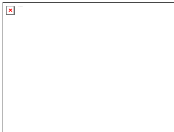
04 cesta do Šerkovic