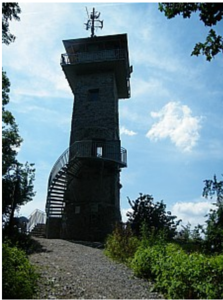
05 Alexandrova rozhledna