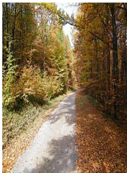
04 lesní cesta