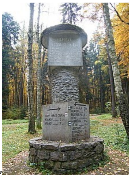
06 památník Hradské cesty