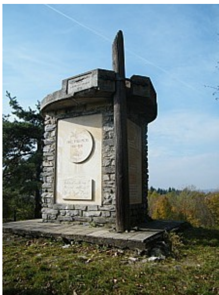
05 Máchův pomník