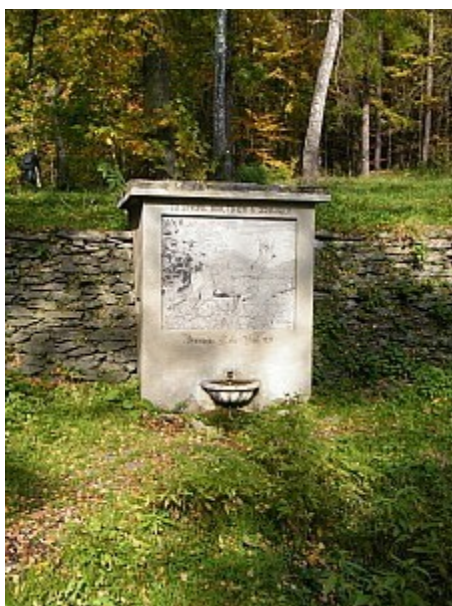
03 studánka U srnce