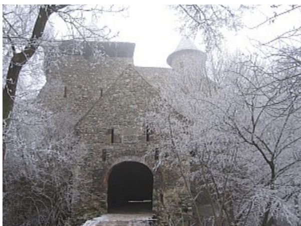
07 Nový hrad