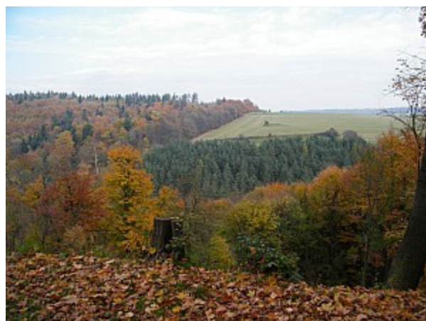
08 výhled do okolí Vranova