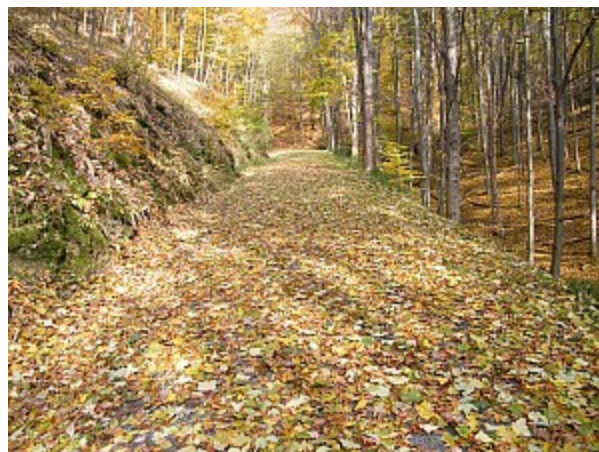
02 cesta Josefovským údolím