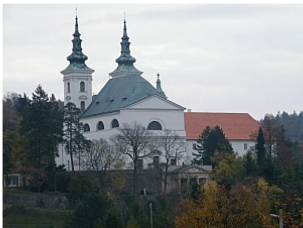
01 chrám Narození P. Marie