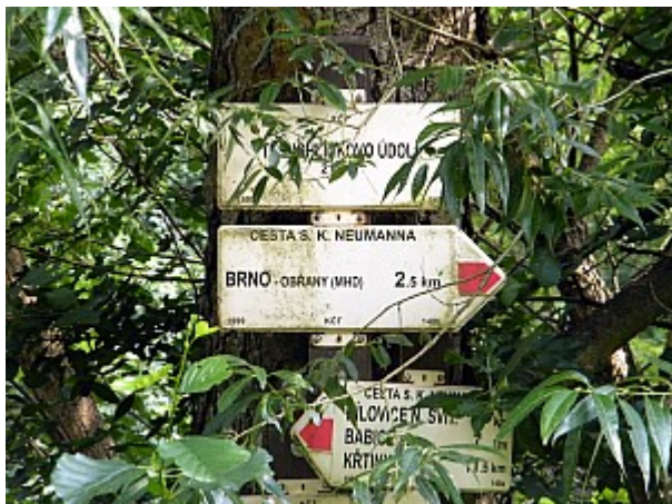
01 rozcestník Těsnohlídkovo údolí