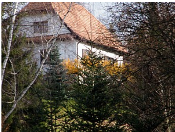
03 hájenka J. Ressela