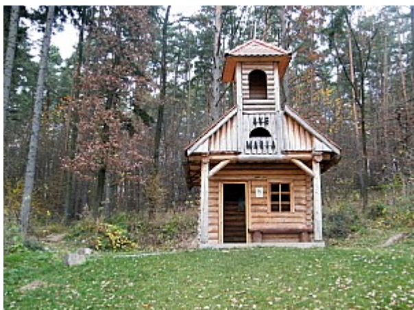
09 kaplička Mitrovských