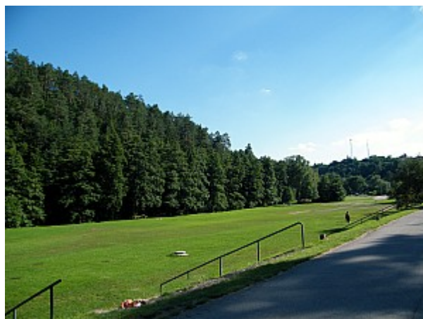
10 Mariánské údolí