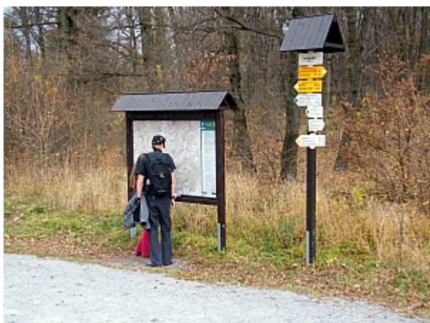
05 rozcestník Kopaniny