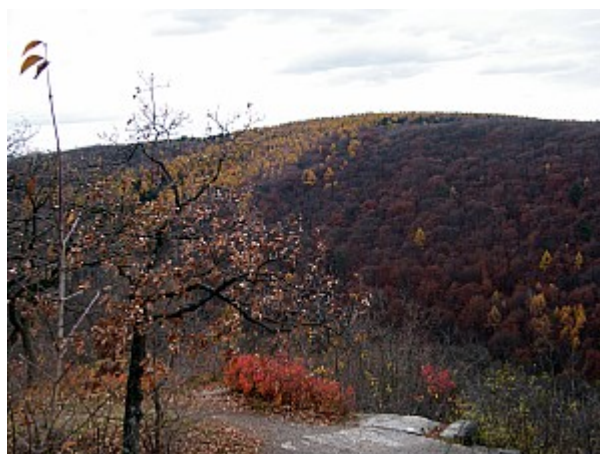
06 pohled z Horneku