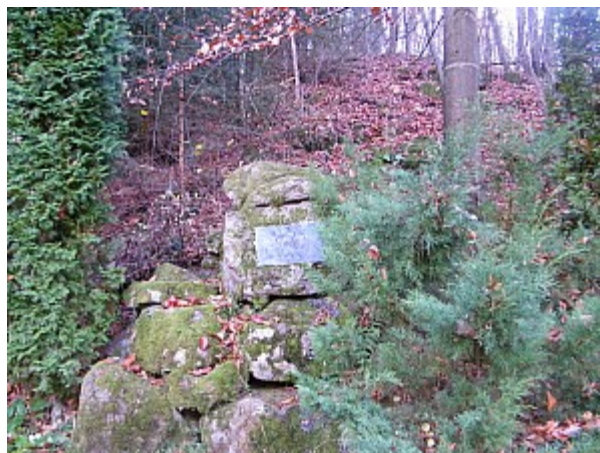
02 památník R. Těsnohlídka