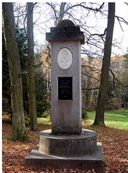
04 památník J. Ressela