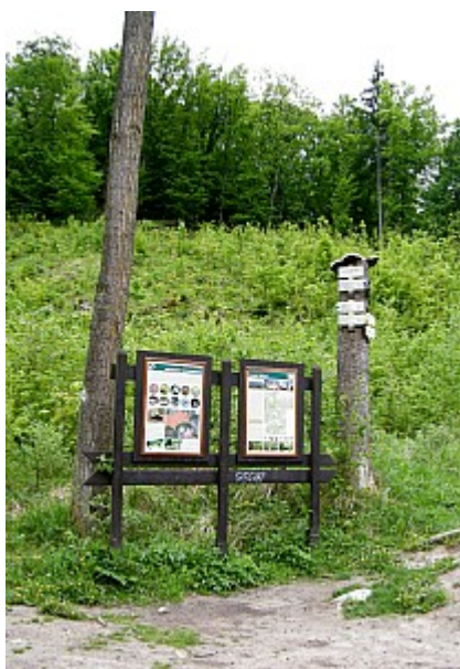
07 rozcestník Ochozská jeskyně