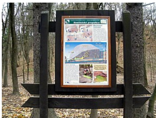
08 Hostěnické propadání