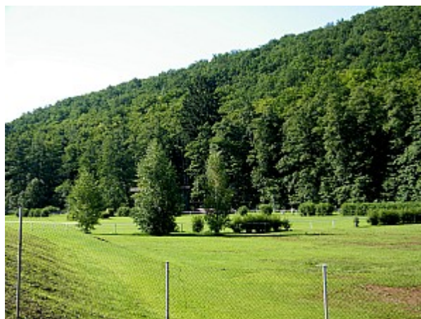
06 Mariánské údolí