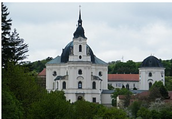
01 chrám Jména Panny Marie