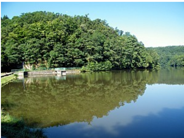
07 údolní nádrž