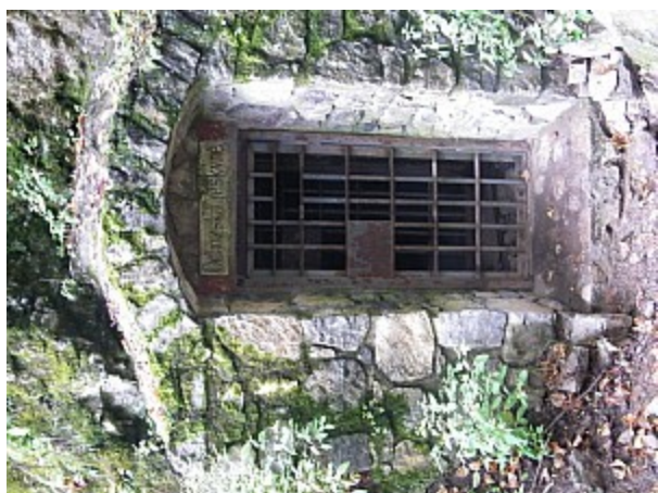
03 Ochozská jeskyně