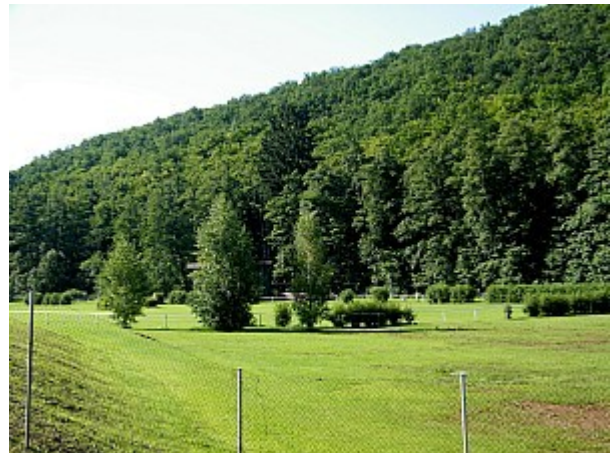
06 Mariánské údolí