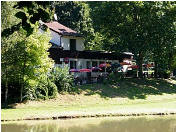
05 Muchova bouda