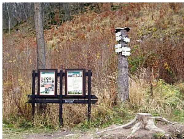
04 rozcestník Ochozská jeskyně