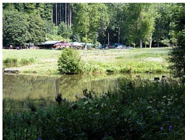
02 rybník Pod Hádkem