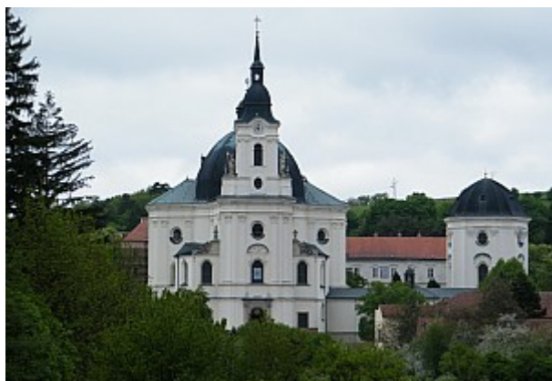
01 chrám Jména Panny Marie