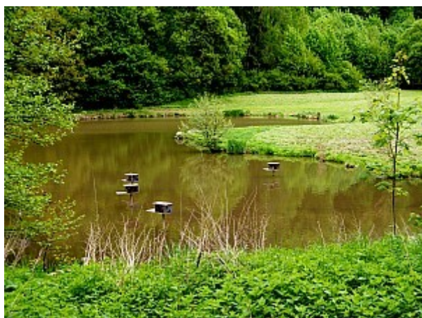
01 rybník Pod Hádkem