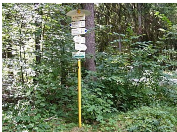
05 rozcestník U Tří Javorů