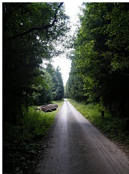
04 přírodní park Říčky