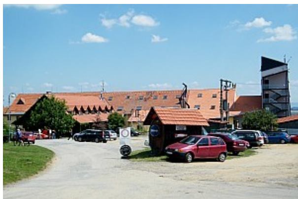
07 Farma B. Polívky