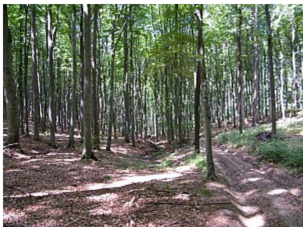
03 přírodní park Říčky