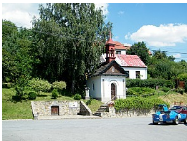
06 kaplička sv. Jana Křtitele