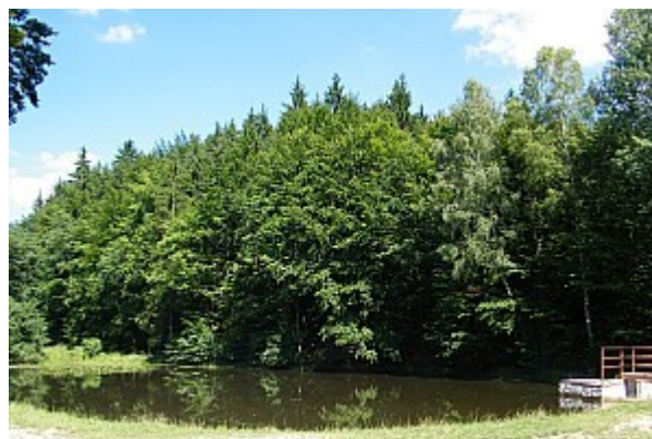
08 retenční nádrž Habrová studánka