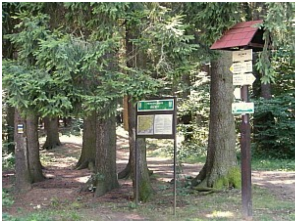
09 rozcestník Jelenice