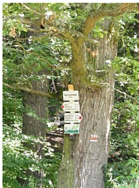
02 rozcestník Pod Lhotkami