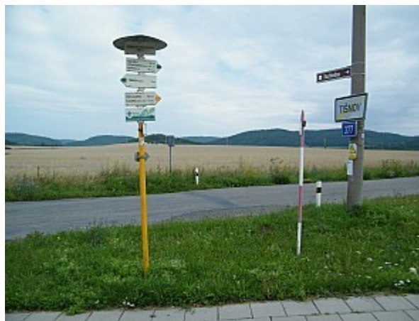
02 turistické informační místo