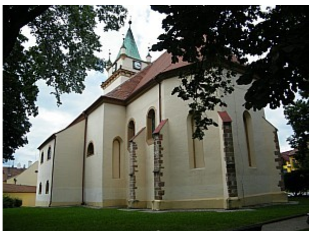
05 kostel sv. Václava v Tišnově