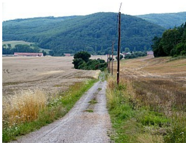
04 cesta do Šerkovic