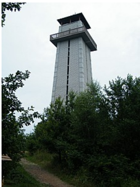
01 rozhledna Klucanina