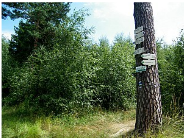
03 rozcestník Nad Díly