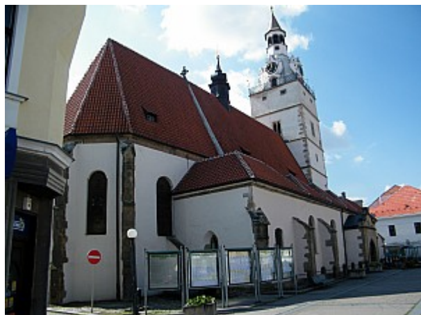
07 chrám Nanebevzetí P. Marie