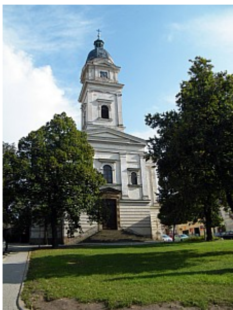
015 kostel sv. Petra a Pavla