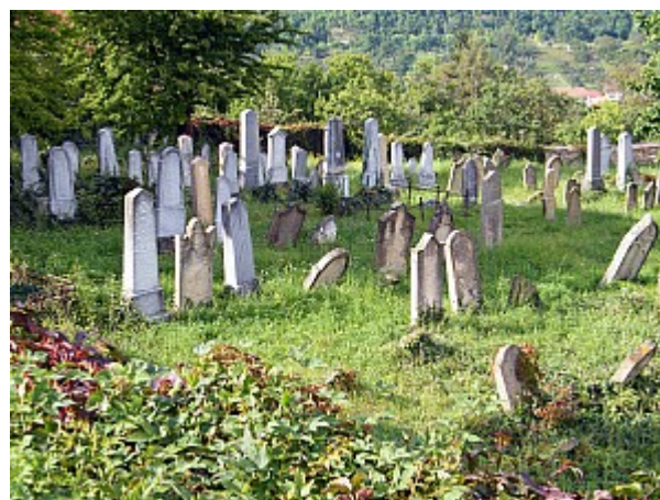
016 židovský hřbitov