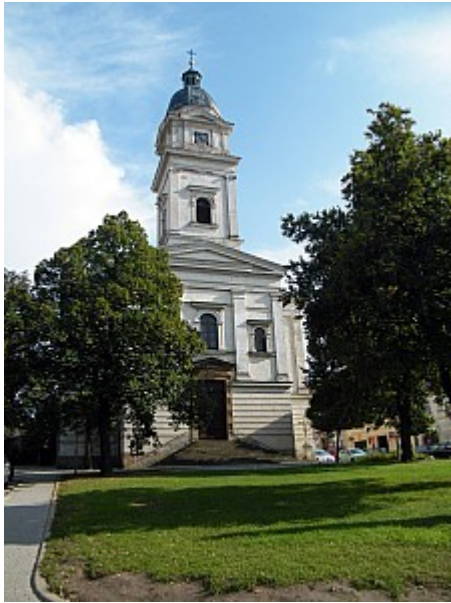
015 kostel sv. Petra a Pavla