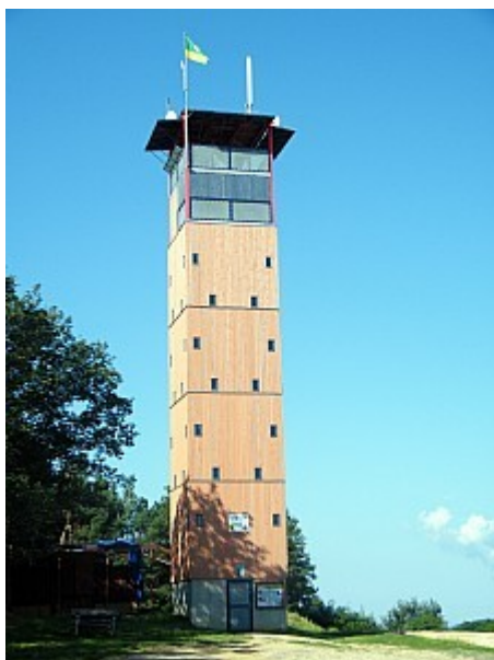
01 rozhledna V. Menšíka