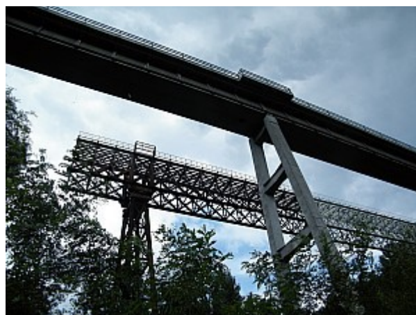
10 ivančický viadukt