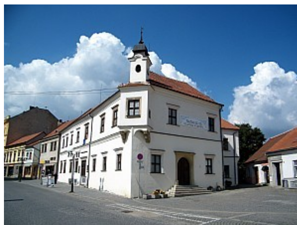
06 památník Alfonse Muchy