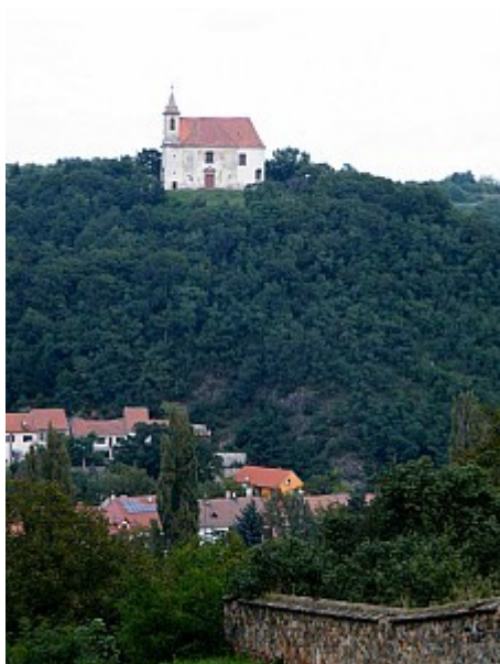
013 kaple sv. Antonína