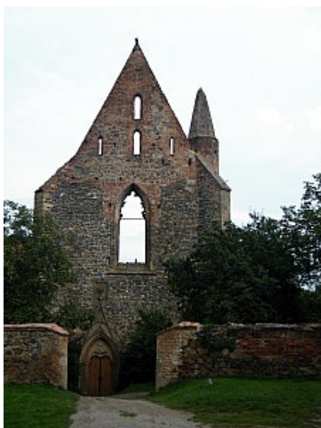
011 klášter Rosa coeli