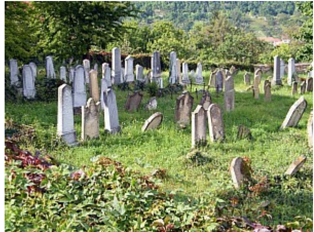
016 židovský hřbitov