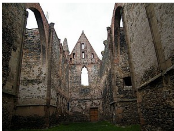
012 zřícenina klášterního kostela