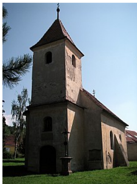
08 kaple Nejsvětější Trojice