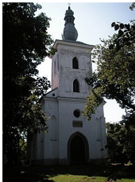
02 kaple sv. Jakuba