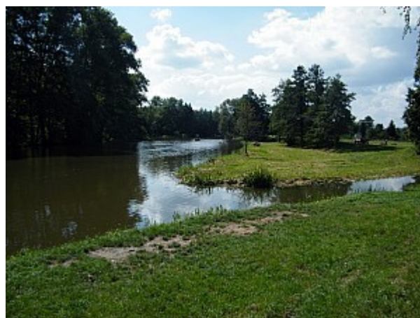
04 soutok řek Jihlavy s Rokytnou