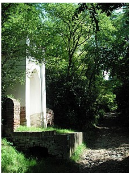
03 křížová cesta