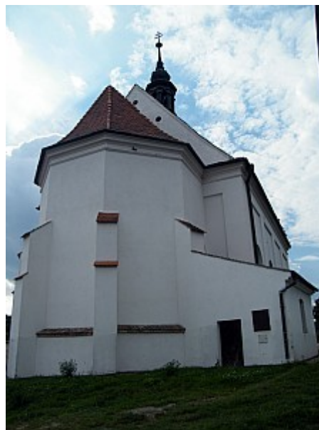
014 kostel sv. Barbory