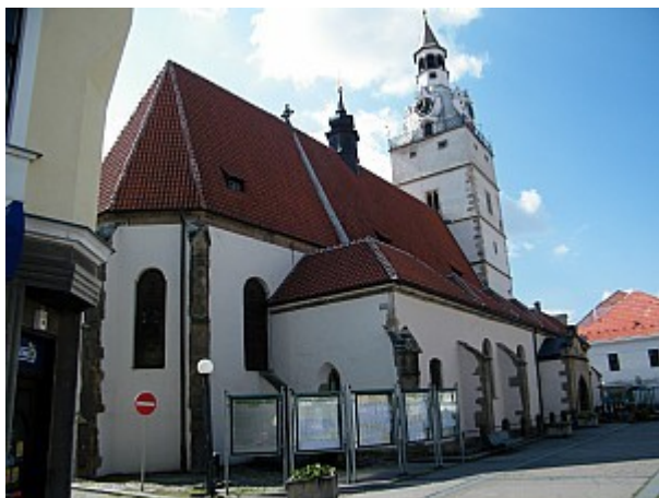
07 chrám Nanebevzetí P. Marie