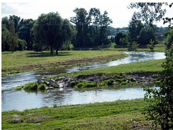
05 soutok řek Jihlavy s Oslavou