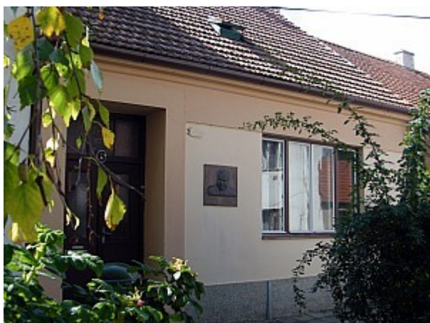
09 rodný dům V. Menšíka