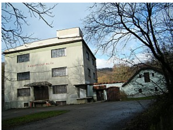
07 Radostický mlýn