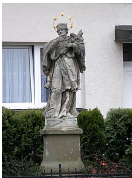
02 socha sv. Jana Nepomuckého