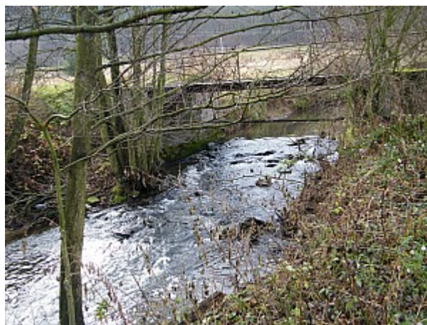
06 říčka Bobrava