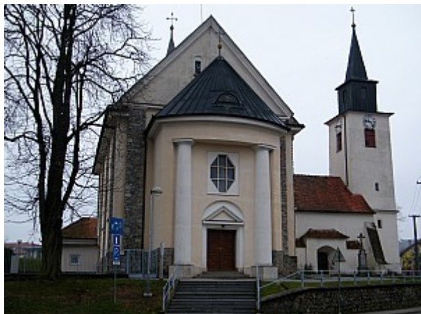
01 kostel sv. Bartoloměje