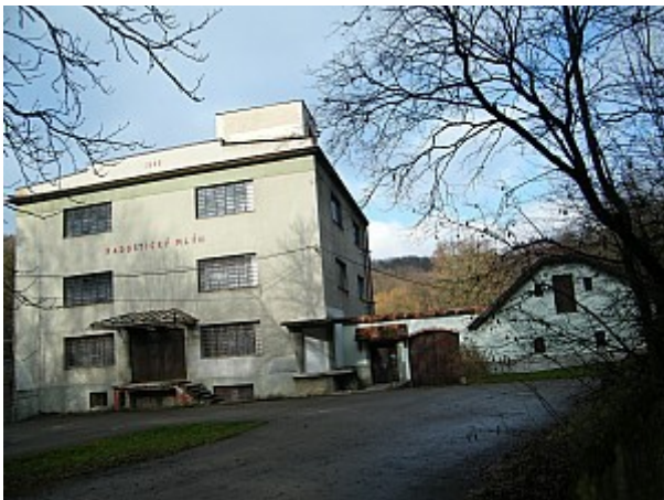
07 Radostický mlýn