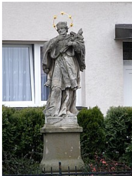
02 socha sv. Jana Nepomuckého