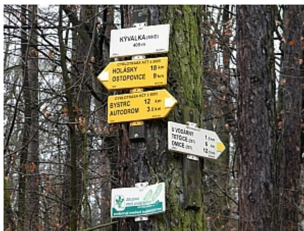
04 rozcestník Kývalka