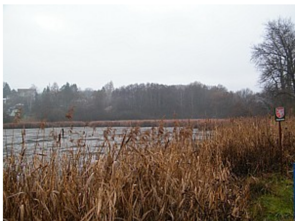
03 Žebětínský rybník