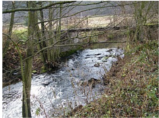
06 říčka Bobrava