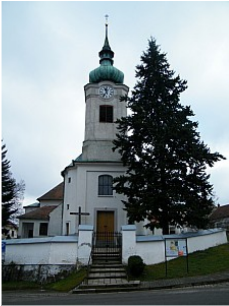
05 kostel Nejsvětější Trojice