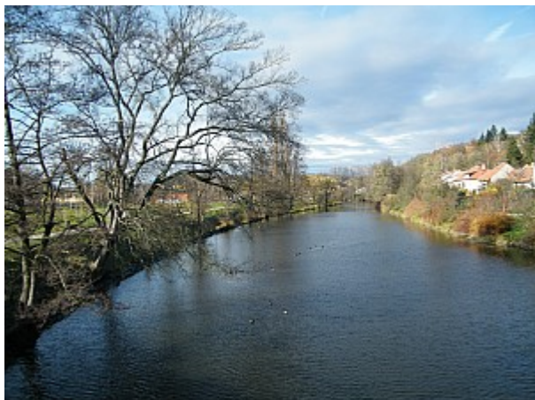
01 řeka Svatka