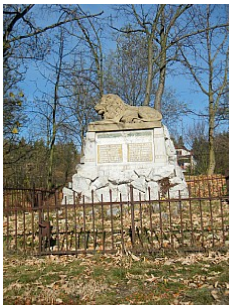
07 památník obětem 1. světové války