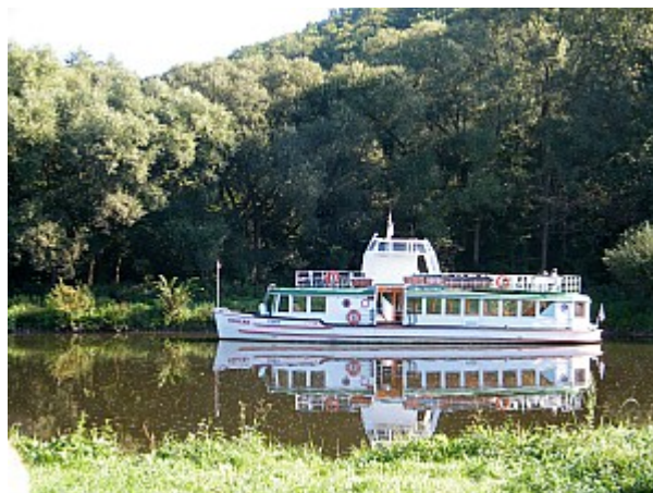
04 lodní doprava