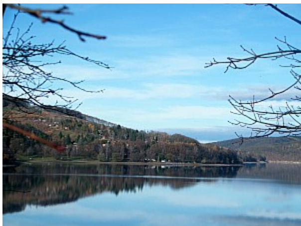
03 Brněnská přehrada