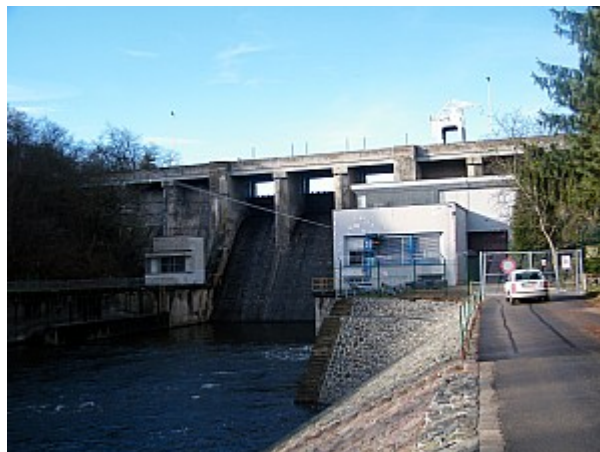
02 hráz Brněnské přehrady