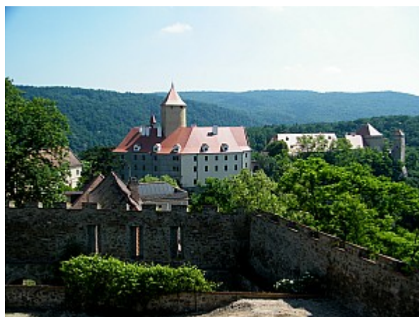
06 hrad Veveří