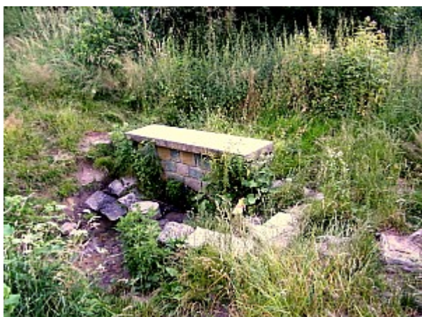
05 Rišova studánka