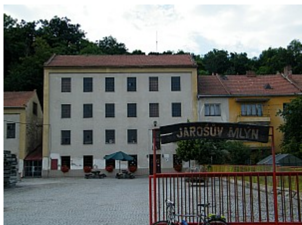
07 Jarošův mlýn