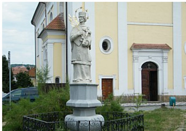
05 socha Jana Nepomuckého