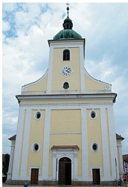
04 kostel sv. Jakuba