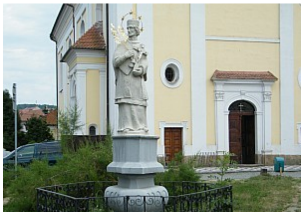
05 socha Jana Nepomuckého