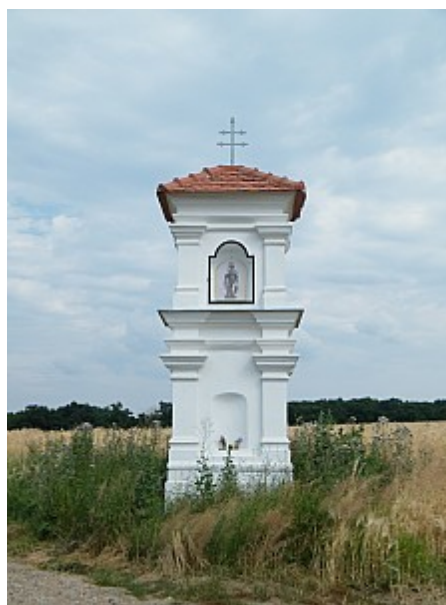
06 boží muka