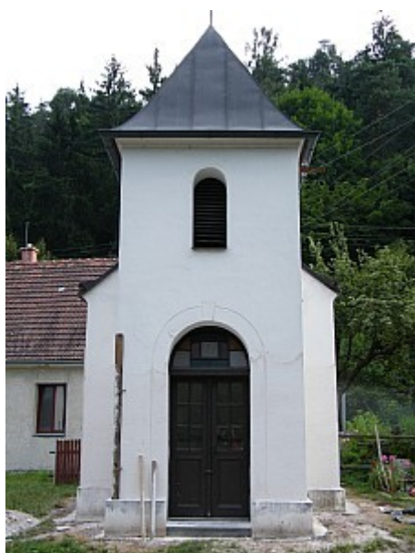
09 kaplička na Šmelcovně