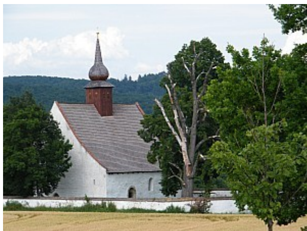
03 kaple Matky boží