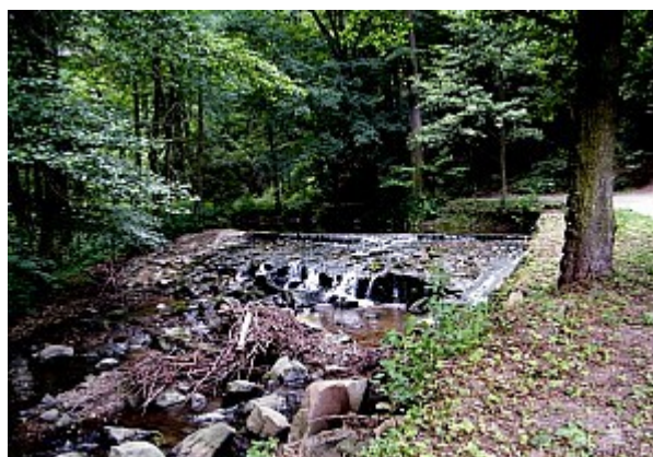
08 Bílý potok