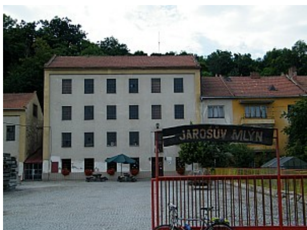
07 Jarošův mlýn