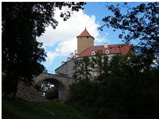
01 hrad Veveří