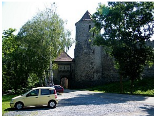
02 hrad Veveří