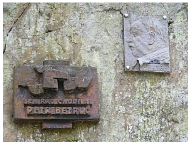
010 pamětní deska