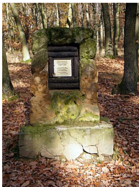
06 Bašného památník