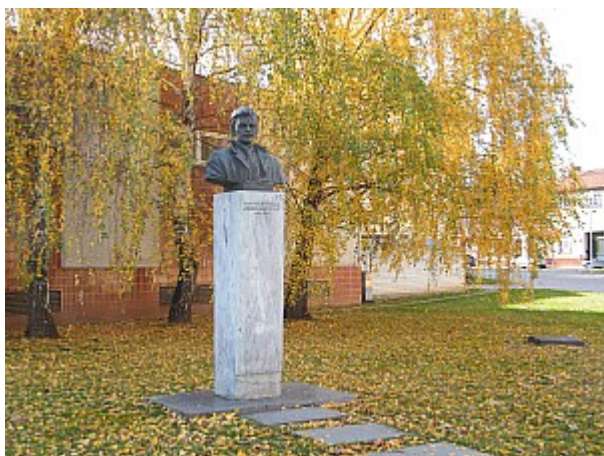
05 Jakub Obrovský