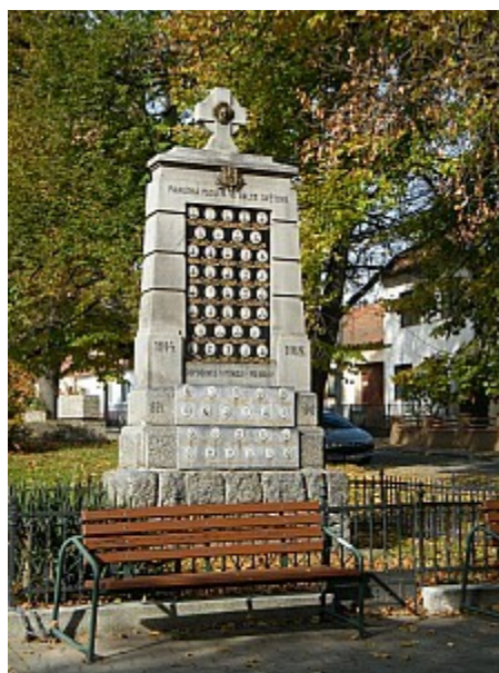
08 památník padlým ve světové válce