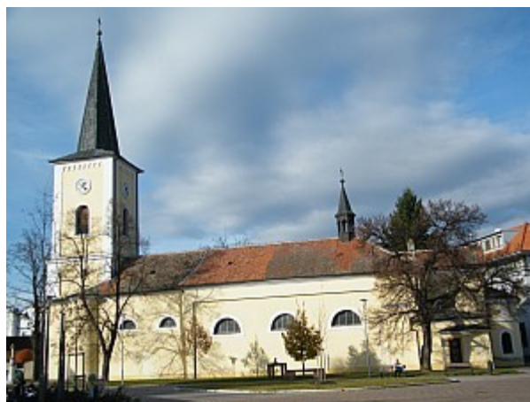
04 kostel sv. Jana Křtitele