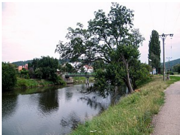
03 řeka Svraka