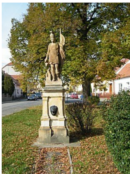
07 socha sv. Floriana