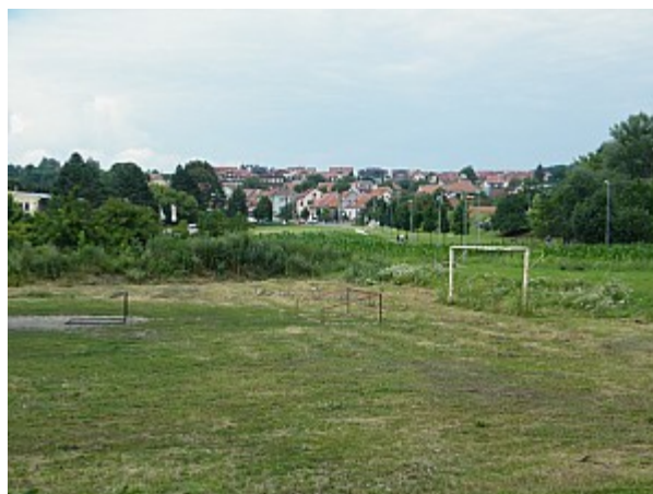
02 pohled na Kníničky od řeky Svratky