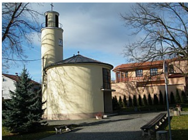
01 Kaple sv. Cyrila a Metoděje