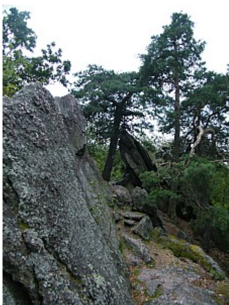
07 hřeben Babiho lomu