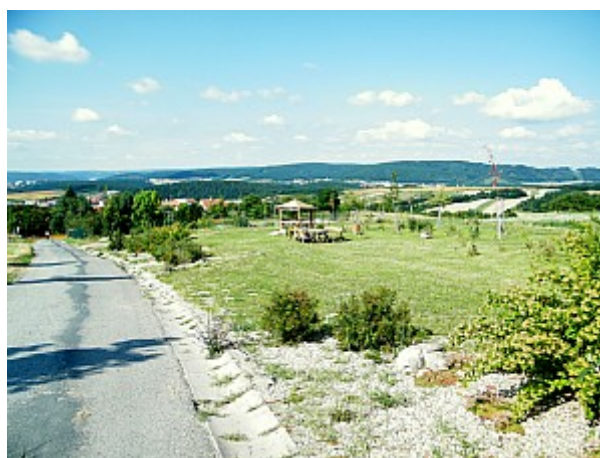
02 okolí Ořešina