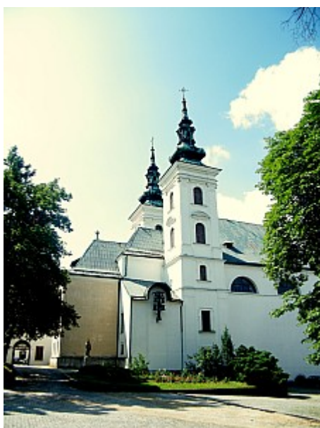
03 chrám Narození P. Marie