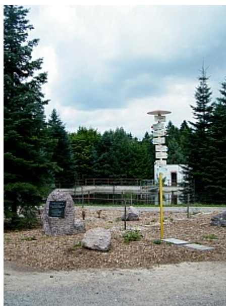
04 U Jelínka