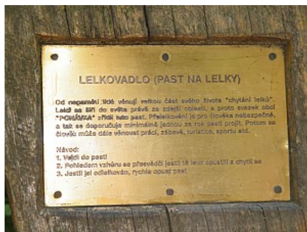
06 past na lelky