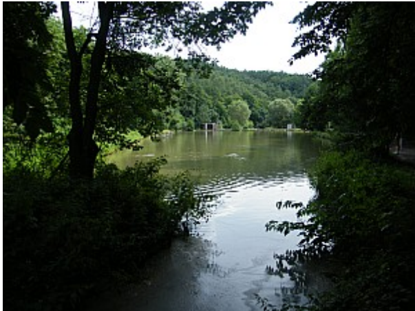
09 údolí Ponávky