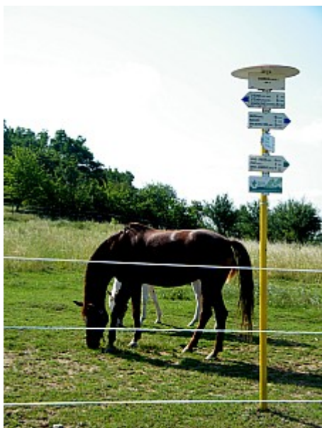
01 rozcestník Horka