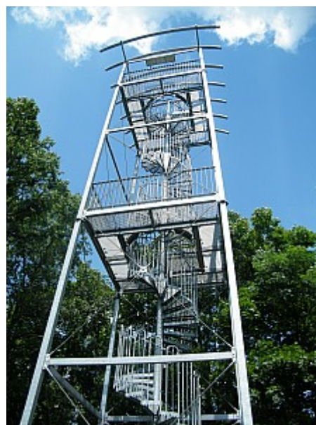
08 Ostrá horka