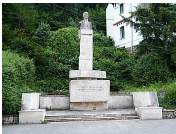
04 Stanislav Kostka Neumann