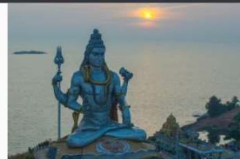
Socha boha Šivy v městě Murudéšvar

Další božstva, která mají nezastupitelné místo v mnoha indických domácnostech a chrámech, jsou například bohyň Lakšmí - manželka boha Višnu, kterého doprovází jako bohyň ké opičímu králi Hanumánovi s tělem člověka, opičím dnoucímu nadpozemskou silou jsou chystány mnohé išlivé vládkyni času vyobrazené s lidskými hlavami kolem terou uctívají lidé převážně v oblasti Bengálska. Samotné