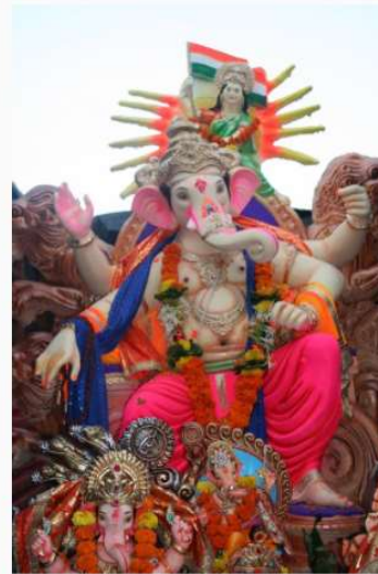
Socha Ganéši při svátku Ganéša Čaturthí, Bombaj (Tereza Menšíková, 2017)

Šívův syn Ganéša je vyobrazovaný jako tloušťk s bílou sloní hlavou, mnoha pažemi, ve kterých drží sladké koláčky, sekeru či laso a s vychytralou krysou po boku, na které jezdí. Toto mírumilovné božstvo je uctíváné před započatím každé činnosti, aby se dílo dařilo a mělo hladký průběh. Jeho narození se každoročně slaví během desetidenního festivalu Ganéša Čaturthí , při kterém jsou Ganéšovy malé i velké sochy vynášeny za hudby a všeobecného veselí do ulic, aby byly doneseny k břehům oceánu a vypuštěny do vody.