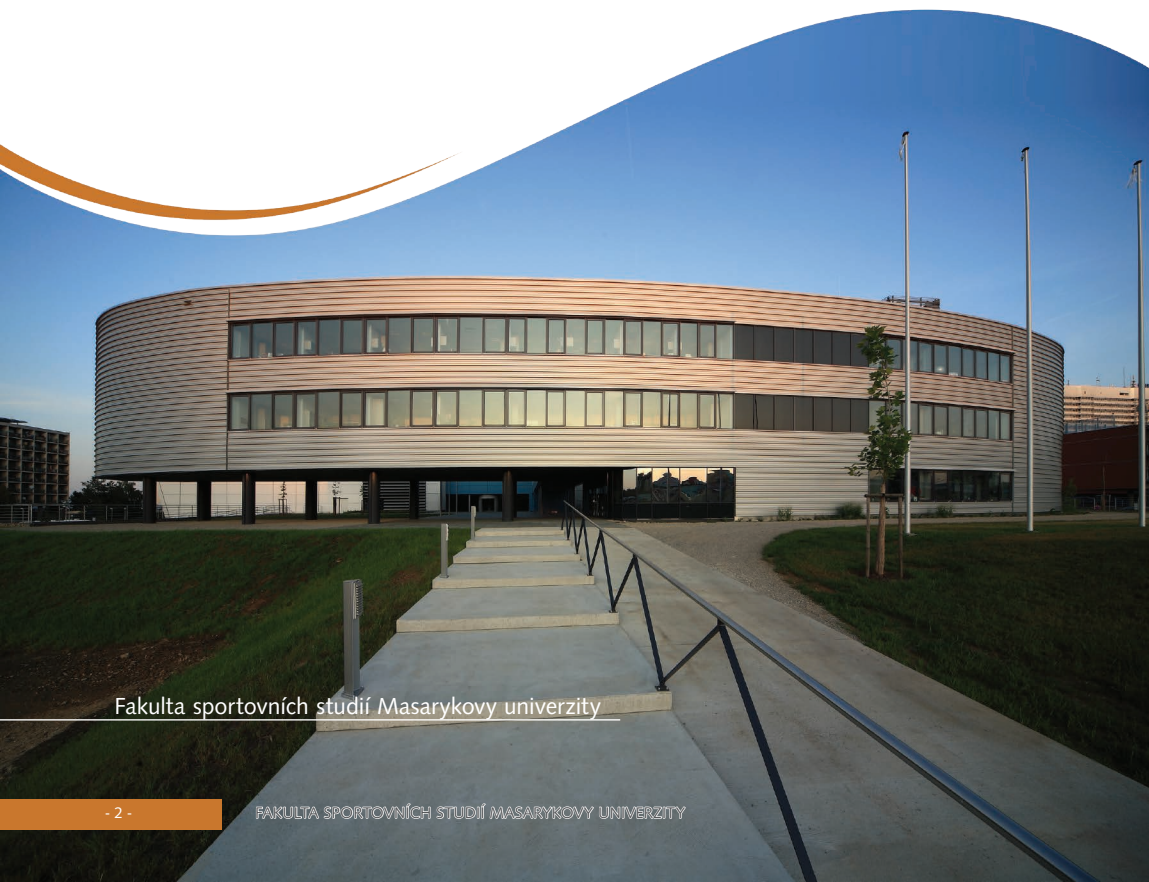
Fakulta sportovních studií Masarykovy univerzity