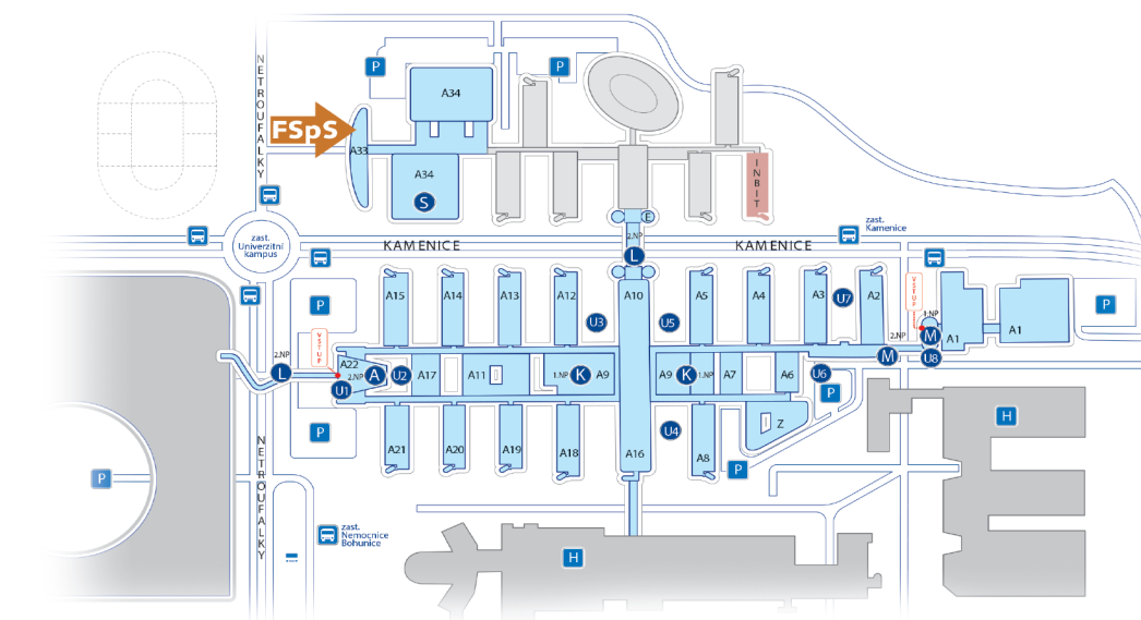
Mapka areálu Univerzitního kampusu MU