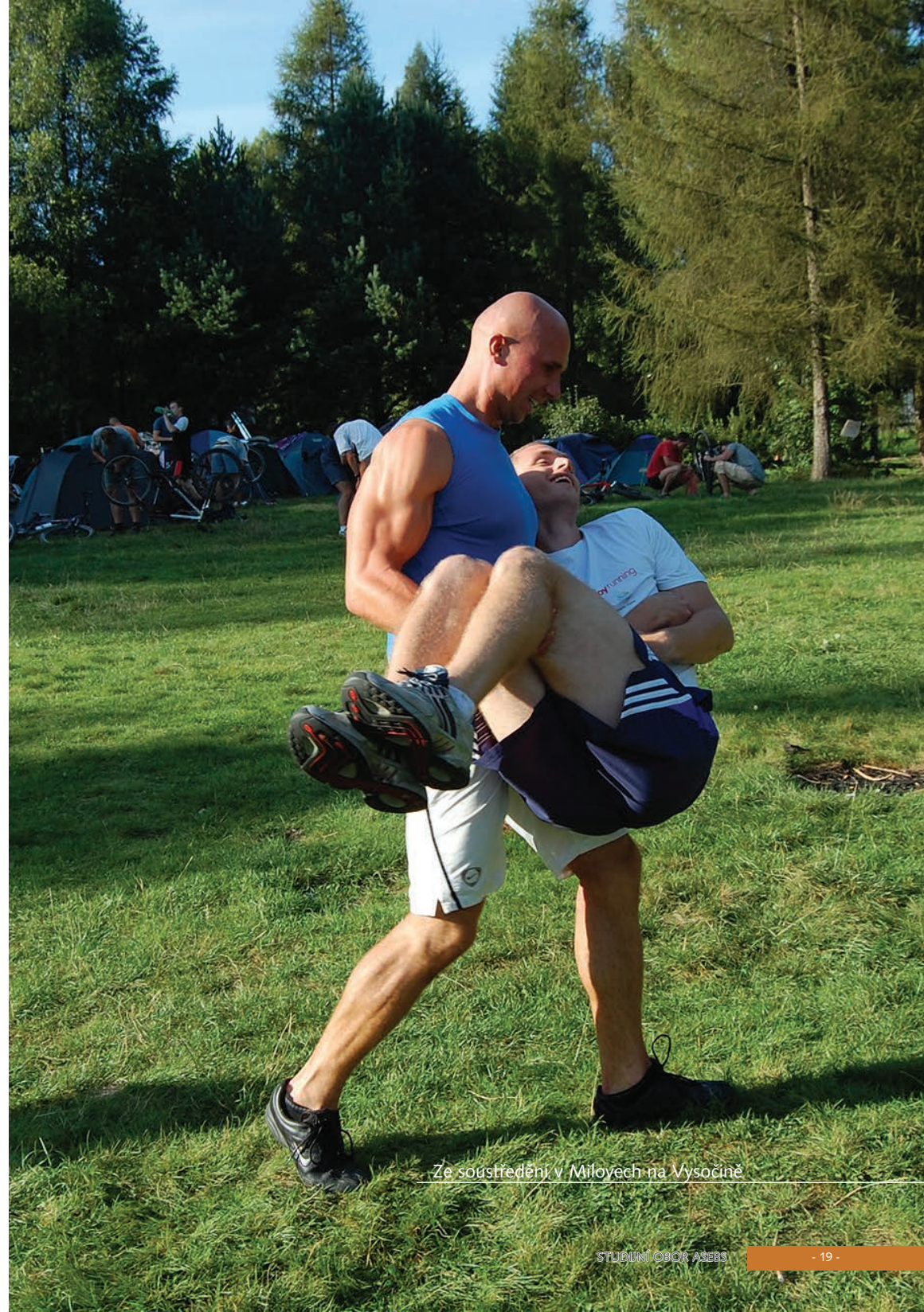
Ze soustředění v Milovech na Mysocině