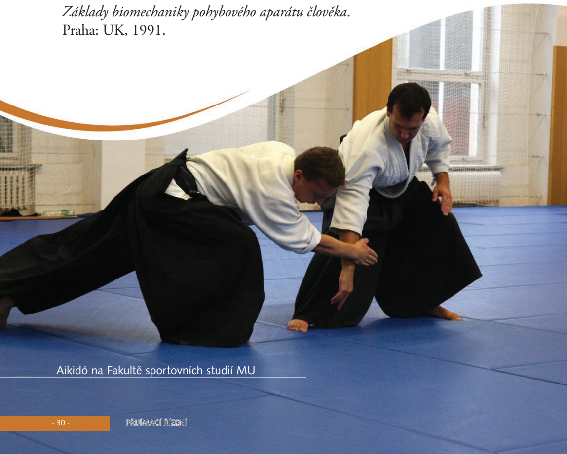
Aikidó na Fakultě sportovních studií MU

VILÍMOVÁ, V. Didaktika tělesné výchovy. Brno: Paido, 2002.