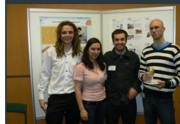
Účastníci Workshopu z VUT Brno

Na závěr chci poděkovat všem respondentům za vyplnění dotazníku - na základě jeho vyhodnocení budeme modifikovat další aktivity projektu.