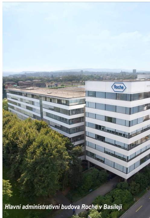
Hlavní administrativní budova Roche v Basileji