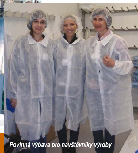
Povinná výbava pro návštěvníky výroby