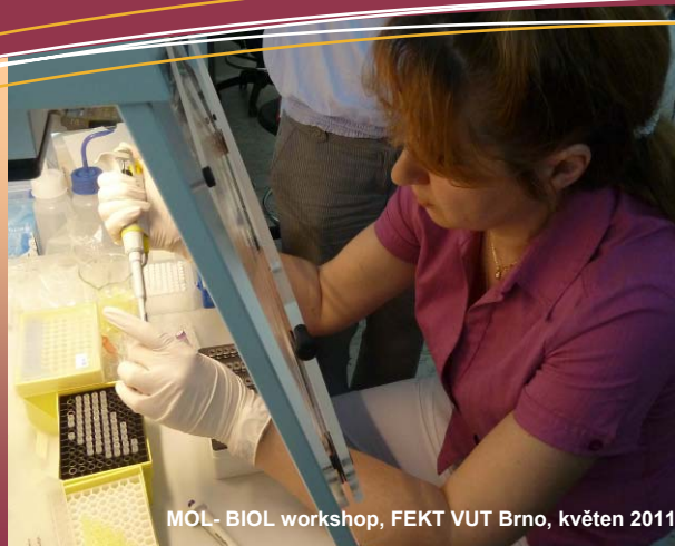
MOL- BIOL workshop, FEKT VUT Brno, květen 2011