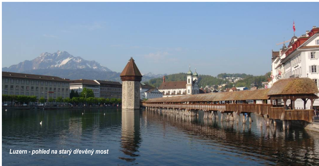
Luzern - pohled na starý dřevěný most