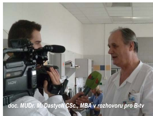
doc. MUDr. M. Dastych CSc., MBA v rozhovoru pro B-tv

Robotizovaná linka také odstranila namáhavou stereotypní práci, minimalizovala možnost vzniku chyb (záměna případně kontaminace vzorků), výrazně zvýšila hygienický standard laboratoře a ušetřila 2 pracovní místa zdravotní laborantky.