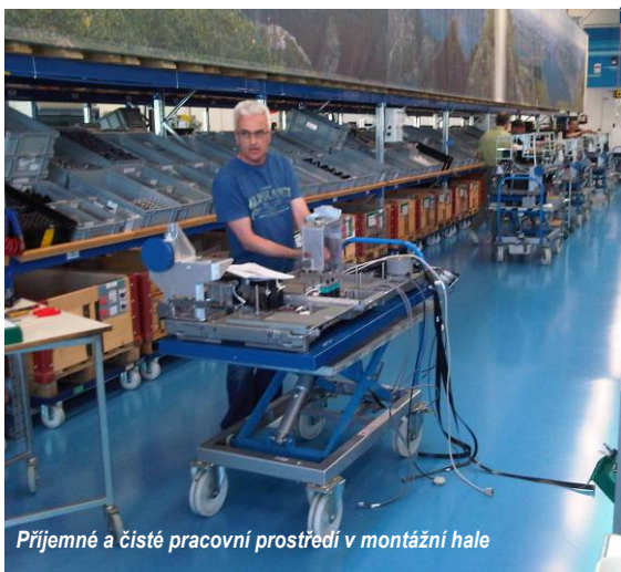
Příjemné a čisté pracovní prostředí v montážní hale