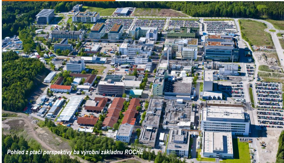
Pohled z ptáčích perspektivy na výrobní základnu ROCHE

Společnost F. Hoffmann-La Roche Ltd. patří mezi deset špičkových farmaceutických společností na světě a svou činností podporovanou intenzivním výzkumem přispívá ke zcela zásadnímu pokroku v oblasti medicíny a farmakoterapie. Jako dodavatel inovativních produktů a služeb pro prevenci, diagnózu a léčbu chorob pomáhá v mnoha směrech zlepšovat zdraví lidí a kvalitu jejich života. Roche je světovou jedničkou v oboru diagnostiky, vedoucím dodavatelem léků pro onkologii, transplantční medicínu a virologii. Společnost F. Hoffmann-La Roche zaměstnává více než 80 000 lidí a prodává své produkty ve 150 zemích světa.