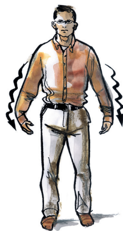
protřepání ramen, paží i zápěstí