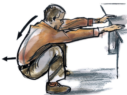
protažení v podřepu