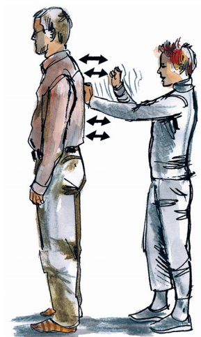
poklepání zad pěstmi (dlaněmi) rukou ve dvojici