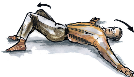
rotační cvik s pokrčenými DK - hlava se vždy otáčí na opačnou stranu než kolena