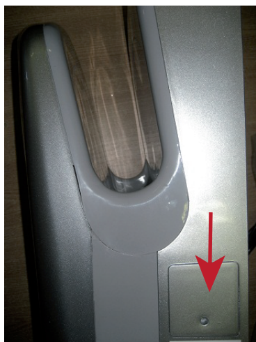
Kryt napájení na boku osoušeče