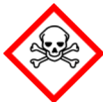
GHS06 - toxické látky