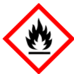
GHS02 - hořlavé látky

Výstražné symboly nebezpečnosti – označování nebezpečných chemických látek a směsí, např.: