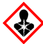
GHS08 - látky nebezpečné pro zdraví