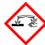
GHS05 - korozivní a žíravé látky