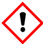
GHS07 - dráždivé látky