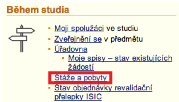
Obr. 1 - Aplikace pro evidenci stáží a pobytů