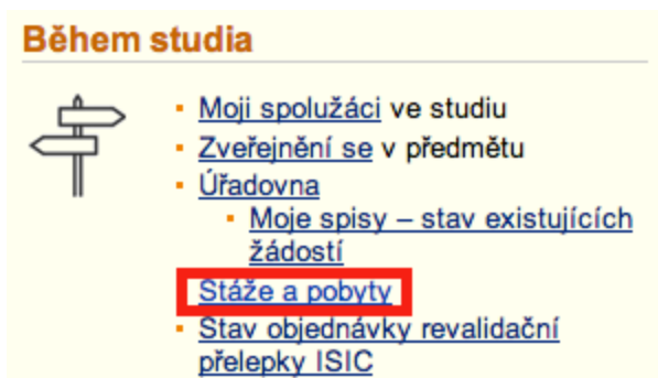
Obr. 1 - Aplikace pro evidenci stáží a pobytů