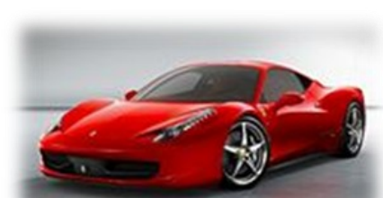
Nový model Ferrari - 458 Italia, na jehož vývoji se podílel i bývalý jezdec formule 1 Michael Schumacher

dodá palivo. V autosalonu, kde se auto prodává, dostává tolik paliva, aby mohlo dojet k nejbližší čerpací stanici a doplnit zásoby. Mezitím i toto palivo, které se nalévá do nádrže prodává, dlouhou cestu od vytěžené ropy po stojan v čerpací stanici. Nyní je tedy načerpáno do nádrže a odtud přechází do motoru, kde se při jeho spalování uvolňuje energie dodávající autu pohyb a rychlost. Zplodiny ze spalování pak odcházejí do okolního životního prostředí. Také silnice, po které jede, má za sebou množství vynaložené práce, energie a materiálu spotřebovaného při výstavbě.