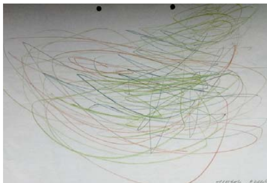
Obr. 2 Čmáranice, 2011, Eliášek, 2 roky, kresba pastelkami, formát A4

Kresba se pro dítě stává hrou (viz obr. 2), která mu ještě řadu let bude sloužit jako neadekvátnější vyjadřovací prostředek. Podle Šickové-Fabrice (2002, s. 103) jsou první kresby vytvořeny z touhy vtisknout svoji stopu do světa a zanechat tak svoji zprávu nebo odkaz. „ Dítě se projevuje od narození. Počínaje jistými instinktivními touhami, které musí dát najevo vnějšimu světu. “ (Read, 1967, s. 129)