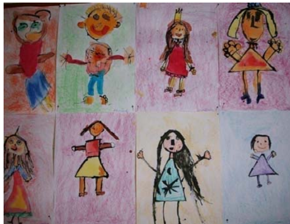
Obr. 6 „Já“, 2013, dětské kresby od 5 do 7 let, kombinované techniky, formát A4

Později se z hlavonožce stává úplný panák, ke kterému dítě přidává další ikonografické znaky, např. ptáček, kytička apod. (Roeselová, 2003, s. 19). V poslední době se spekulovalo o tom, proč je první dětské pojetí postavy právě hlavonožec. O tomto dětském ztvárnění postavy se zmiňuje Šulová (2004, s. 67). Hlavonožec je podle ní nakreslen podle úhlu vidění světa malého tříletého dítěte. Dítě kreslí postavu hlavonožce z toho důvodu, že ze svého pohledu vidí nejprve detailně nohy, oči a obličej osob, které se k němu sklání. Proto je pochopitelné, že prvním dětským ztvárněním lidské postavy je hlava, ze které vycházejí nohy. Podle Davido (2008, s. 24) do kresby postavy dítě promítá samo sebe. Také tvrdí, že dítě začne kreslit postavu tehdy, když si uvědomí vlastní tělesné schéma, tedy až získá představu o svém těle (viz obr. 6).