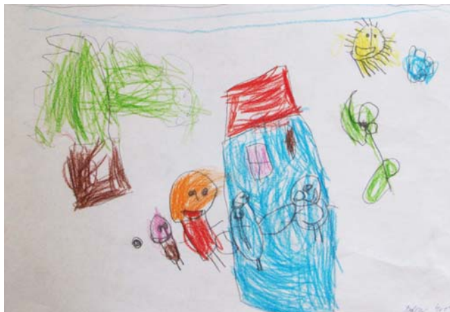
Obr. 5 „ Moje rodina “, 2013, Barunka, 4 roky, kresba tužkou a pastelkami, formát A4

Dítě bezduše kopíruje pohyb ruky, neboť je jeho fantazie ještě málo vyvinutá. Vzniklé obrazce zatím neohromují, jsou pouhým napodobením. Tento kresebný projev nemůžeme pokládat za projev výtvarné tvorby. Následuje předoperační myšlení (asi od 2 do 8 let), které je rozděleno do dvou fází. V první fázi se rozvíjí představivost a symbolické označování (2–4 roky). Dítě v této fázi přechází ze stadia čmáranic do stadia prvotního obrazu. Stylizovaná schémata jsou pozvolna obohacena o detaily (viz obr. 5). Z oválného tvaru a končetin vzniká tzv. hlavonožec (tvář a zároveň postava).