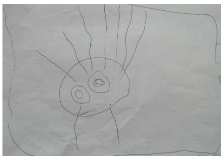
Obr. 4 „ Sluníčko “, 2014, Eliášek, 4 roky, kresba propiskou, formát A4

Z oválného tvaru postupně vznikají další ikonografické znaky, např. slunce a mrak. Na obrázku (viz obr. 4) je zřejmé, že Eliášek se z kresebných geometrických tvarů naučil sestavit rozpoznatelný znak vystihující sluníčko.