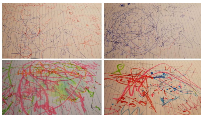
Obr. 1 Oblíbený sešit Charlotky, 2014, Charlotka, 2 roky, kresba fixy a pastelkami, formát A4

Pro každý věk dítěte je typický určitý typ kresby. První pokusy o kresebný projev jsou dané snahou napodobit to, co kreslí jiné děti nebo dospělí. Některé děti se začínají pokoušet o kresbu už ve dvou letech, jiné později. V prvních fázích nejde o nic jiného než o jednoduché čmárání tužkou či pastelkami po papíře (viz obr. 1). V tomto období dítě nemá žádný vztah ke kresbě, pouze napodobuje pohyb ruky.