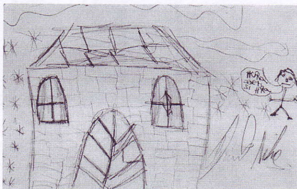
Obrázek 1: Bez názvu , 2013, chlapec, 17 let, kresba tužkou, formát A4, foto z archivu autorky textu