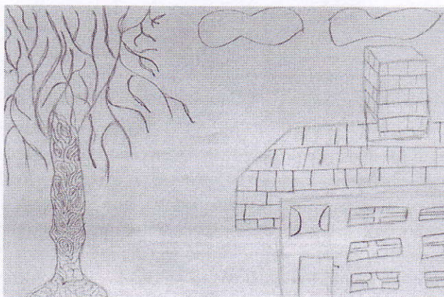
Obrázek 2: Bez názvu , 2013, chlapec, 17 let, kresba tužkou, formát A4, foto z archivu autorky textu