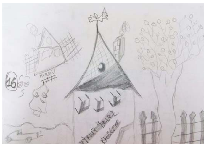
Obrázek 1: Výkup želez , 2013, chlapec, 16 let, kresba tužkou, formát A4, foto archiv autorky textu

Svobodný kresebný projev s obsahem vulgárního postoje je zachycený v kresbě chlapce, který během úkolu vzbuzoval velkou pozornost. Zobrazená dívka je chlapcova platonická láska. Po dokončení své kresby, chlapec dívku z výkresu roztrhnul a začal být nervózní. Poté nakreslil sám sebe se vztyčeným prostředníčkem. Domnívám se, že nenaplněná láska, negativní emoce a životní styl v duchu „Anarchie životních norem“ velmi ovlivnil chlapcův kresebný projev (viz obr. 10).