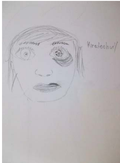
Obrázek 8: Bez názvu , 2013, chlapec, 15 let, kresba tužkou, formát A4