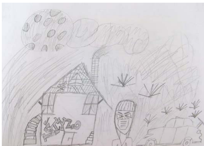
Obrázek 6: Bez názvu , 2013, chlapec, 16 let, kresba tužkou, formát A4