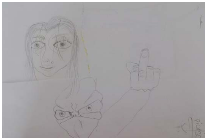
Obrázek 10: Bez názvu , 2013, chlapec, 17 let, kresba tužkou, formát A4, foto archiv autorky