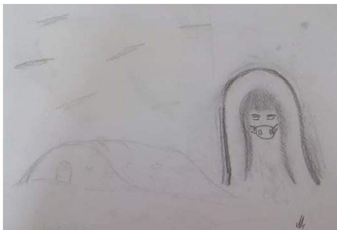
Obrázek 3: Bez názvu , 2013, chlapec, 16 let, kresba tužkou, formát A4, foto archiv autorky textu