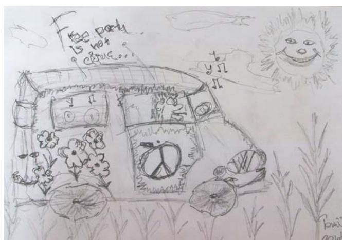
Obrázek 7: Free party is not crime , 2013, chlapec, 20 let, kresba tužkou, formát A4