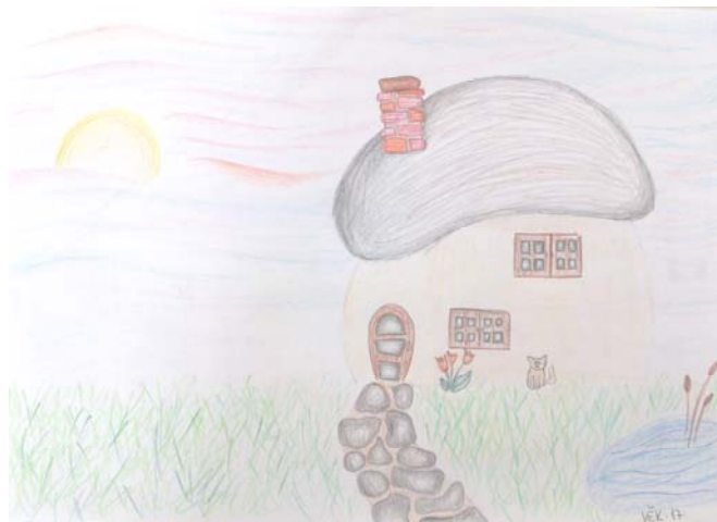
Obrázek 9: Bez názvu , 2013, dívka, 17 let, kresba tužkou a pastelkami, formát A4