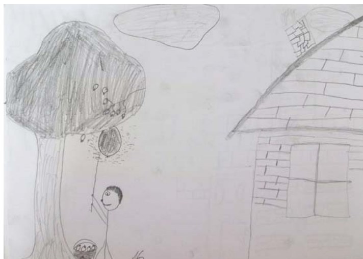
Obrázek 2: Nesnáším vosy , 2013, chlapec, 16 let, kresba tužkou, formát A4