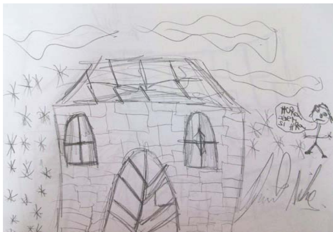
Obrázek 5: Bez názvu , 2013, chlapec, 17 let, kresba tužkou, formát A4