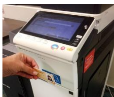
Přihlášení pomocí ISIC