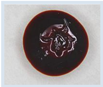
Úplná destrukce klíštěte po cca 15 minutách