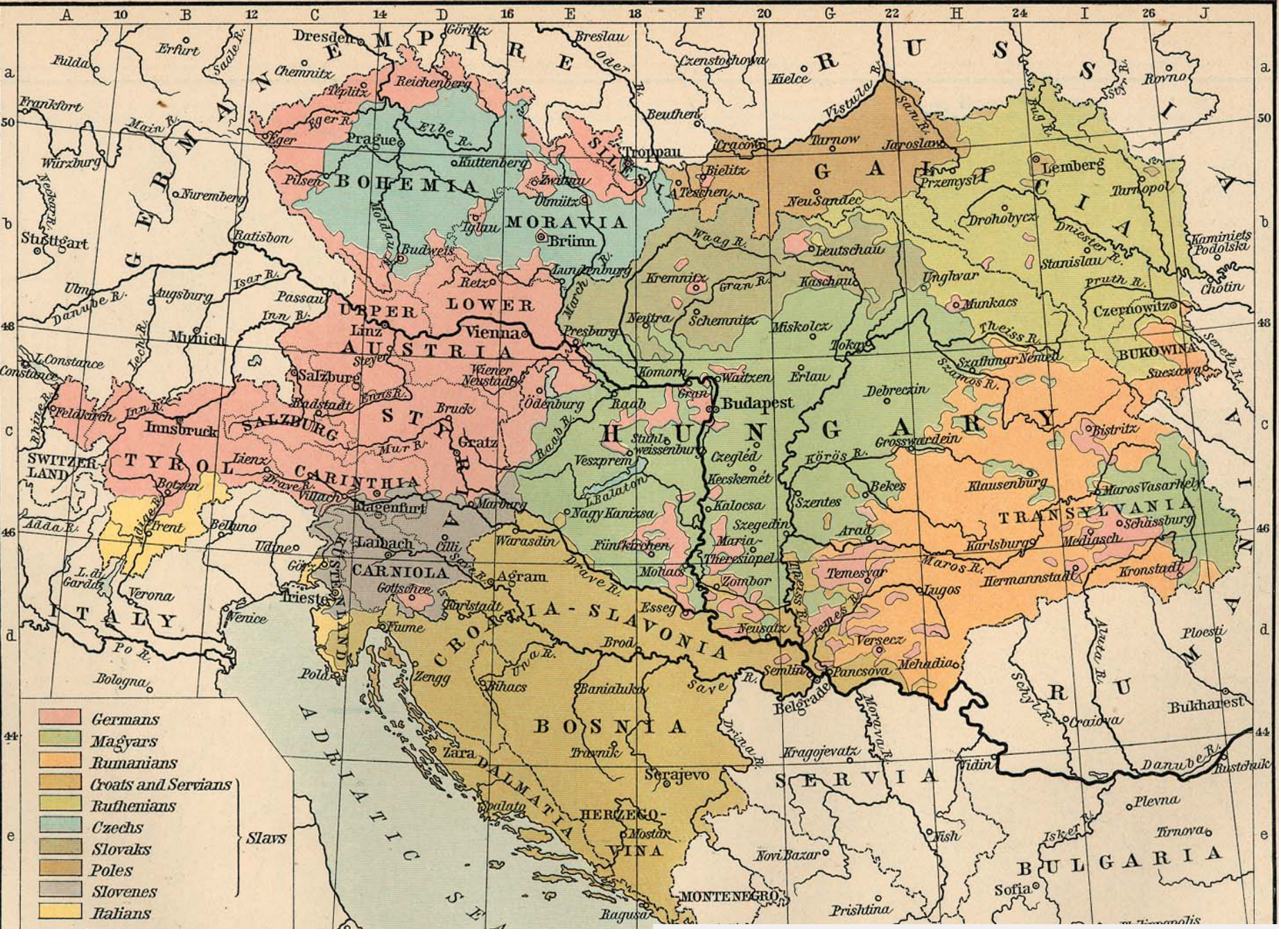
Národnostní mapa 1911