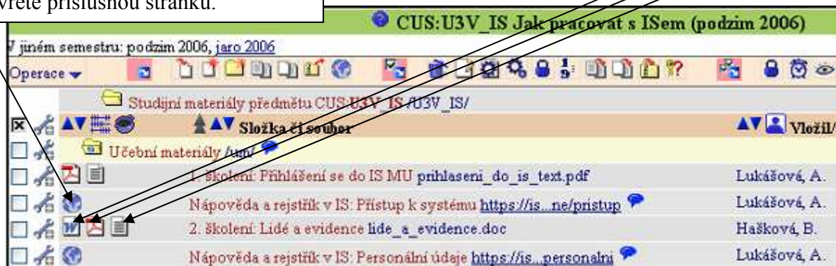
Obr. 7: Otevření a stažení souboru ve Studijních materiálech

Ikonky formátu souboru (pokud na ní podržíte myš, zobrazí se vám formát a velikost souboru): doc, pdf, txt.