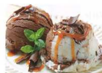
8. čokoládová a vanilková .....