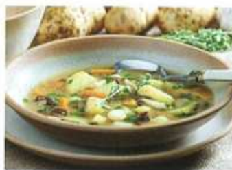
2. bramborová .....