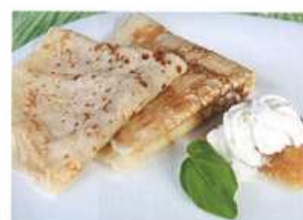
7. .... se šlehačkou