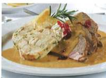
6. .... svíčková omáčka a knedlíky