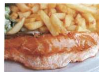
3. .... a hranolky