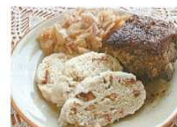
4. vepřové maso, zelí a .....