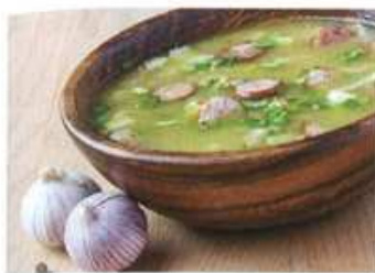
1. česneková ..... polévka .....