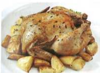
5. .... a brambory