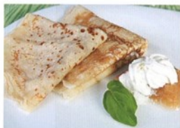
7. .... se šlehačkou