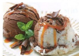
8. čokoládová a vanilková .....