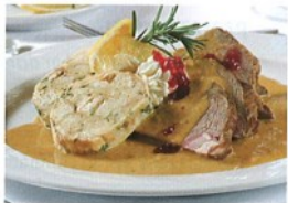
6. .... svíčková omáčka a knedlíky