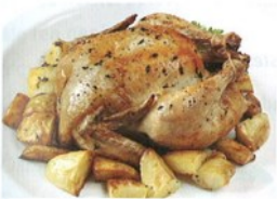
5. .... a brambory