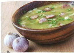
1. česneková ..... polévka

polévka | hovězí maso | palačinky | polévka | losos | knedlíky | kuře | zmrzlina