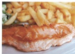
3. .... a hranolky