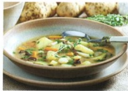
2. bramborová .....