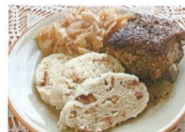
4. vepřové maso, zelí a .....