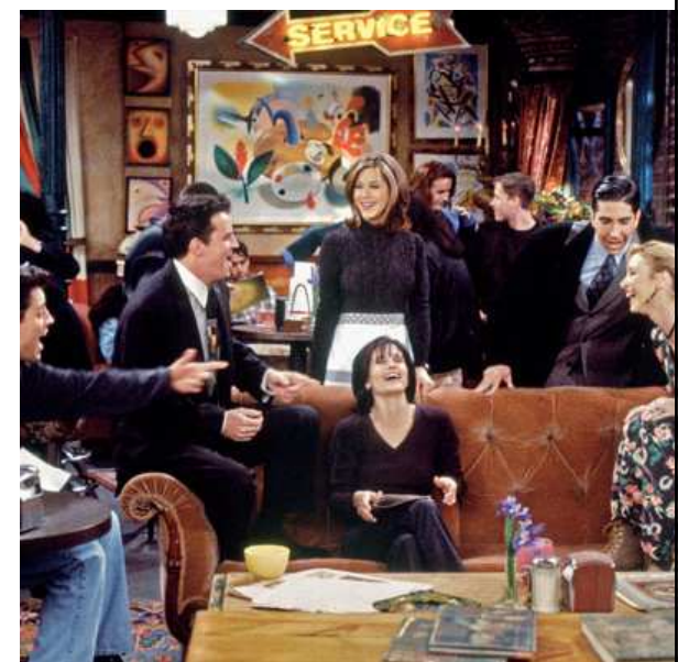
KAMARÁD A KAMARÁDKA