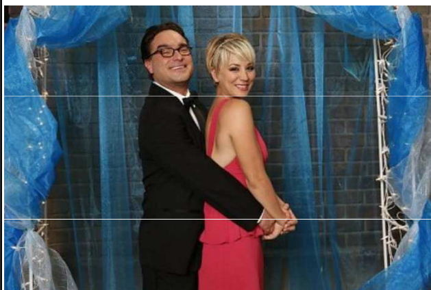
PŘÍTEL A PŘÍTELKYNĚ