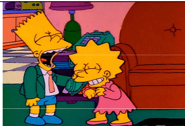
BRATR / SYN / VNUK A SESTRA / DCERA / VNUČKA