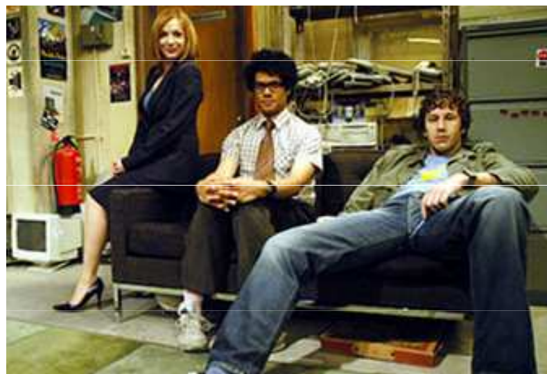
KOLEGYNĚ A KOLEGA