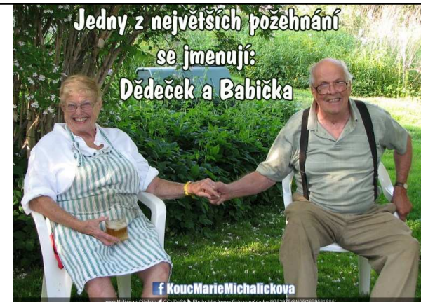
BABIČKA A DĚDEČEK