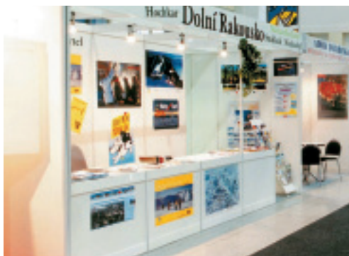
Informační pult – slouží na rozložení propagačních materiálů a plakátů

maximálně jednoduchý způsob technického řešení ■ finančně velice výhodný zejména pro menší společnosti ■ stěny mohou být využity po zavěšení obrazů ■ informační pult slouží např. pro rozložení informačních prospektů ■ stropní rastr počítá s možností instalace osvětlení