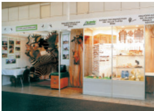
Skleněné vitríny – patří mezi standardní prvek systému