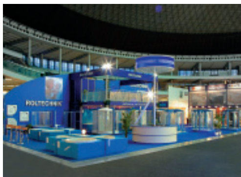
Patro a zábradlí – tvoří základní konstrukci expozice

novinka na trhu stavebnicových systémů ■ jeho atraktivní design vyniká originalitou a výjimečností ■ představuje skutečný luxus ve výstavnictví ■ při výstavbě na větší ploše vyniknou všechny prvky, které odlišují expozici od okolních ■ splní i tu nejnáročnější potřebu vyzkoušet něco nového a neotřelého ■ expozice působí vzdušně a prostorně ■ benefitem je velmi dobrá stabilita konstrukčních dílů ■ splňuje normy EU pro výstavbu patrových expozic, je proto ideální pro výstavbu expozic v zahraničí