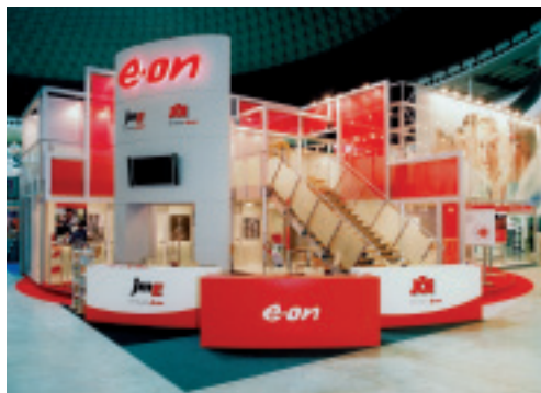
Prosklené schodiště – efektně spojuje přízemí s plochou patra