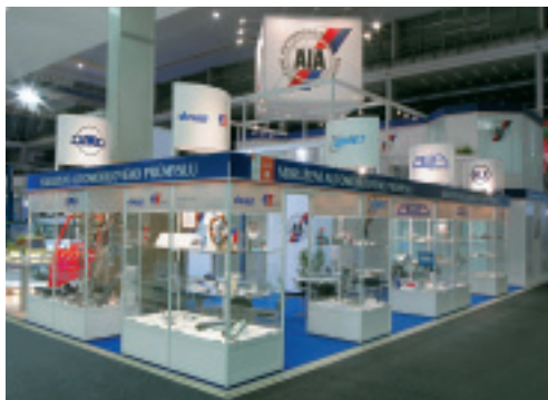
Konstrukce expozice – základ je sestaven z prosklených Octanormových vitrín