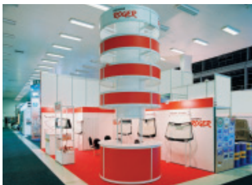
Nepravidelné úhly – umožňují vytvářet různá půdorysná členění

výhodou systému je jeho variabilita ve spojení s příznivou cenou ■ snadná montáž s širokými možnostmi využití s mnoha nadstavbovými prvky ■ lze vytvářet různorodé půdorysné členění ■ pro sladění jsou nabízeny různé typy nábytku nebo doplňků jako např. rovné či sklonné poličky založené na principu Octanorm