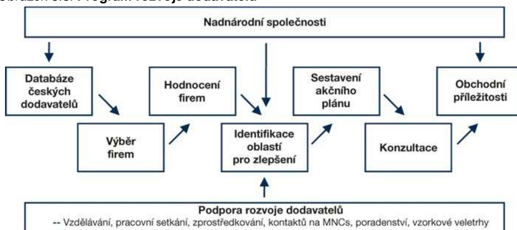
Obrázek 8.5: Program rozvoje dodavatelů